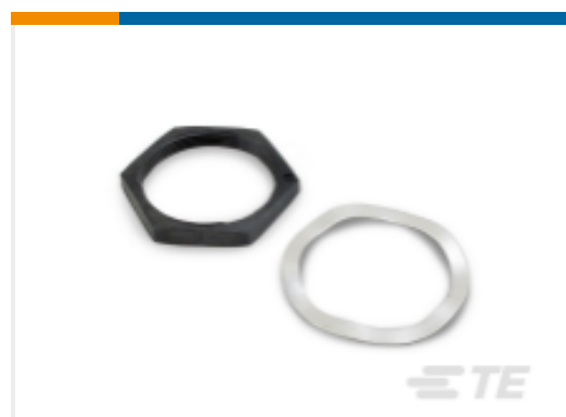
TE 产品编号2414-001-2486 DEUTSCH HDP20 安装硬件