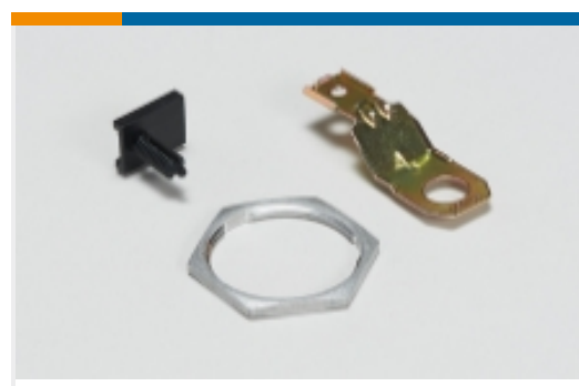
其他汽车连接器附件(14)