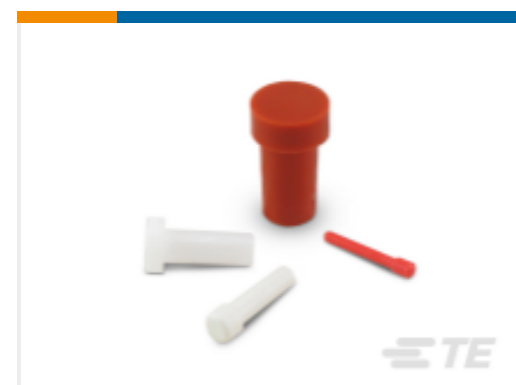
TE 产品编号0413-204-2005 DEUTSCH 密封盲堵