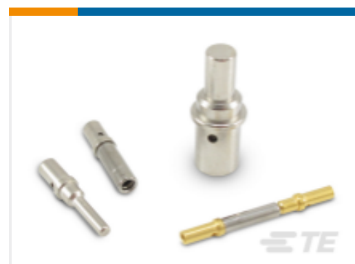
TE 产品编号0462-209-16141 DEUTSCH 实芯端子