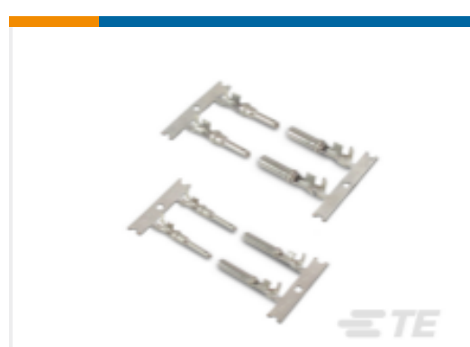
TE 产品编号1060-16-0122 DEUTSCH 冲压成型端子