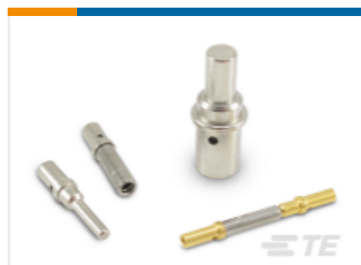
TE 产品编号0462-203-08141 DEUTSCH 实芯端子