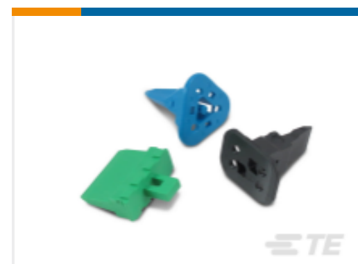
TE 产品编号W8S-P012 DEUTSCH DT 楔形锁紧装置