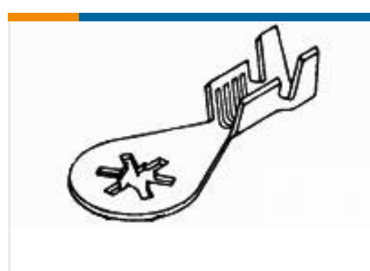
TE 产品编号61795-6 RING 18-14 AWG TPBR