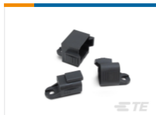
TE 产品编号1011-346-0405 DEUTSCH DT 防尘帽