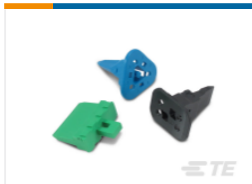
TE 产品编号W8P DEUTSCH DT 楔形锁紧装置