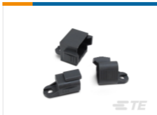
TE 产品编号1011-346-0405 DEUTSCH DT 防尘帽