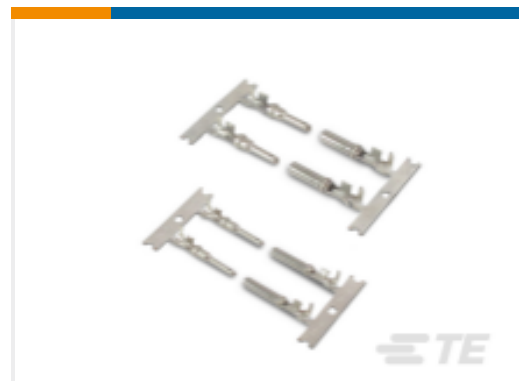
TE 产品编号1062-20-0122 DEUTSCH 冲压成型端子