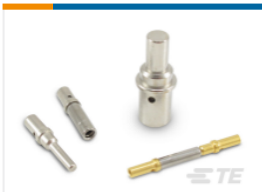
TE 产品编号0460-204-0490 DEUTSCH 实芯端子