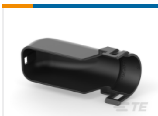
TE 产品编号2112046-2 COVER, 90, FOR 26 POS