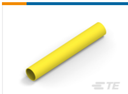
TE 产品编号NB14852001 DWP-125-1/2-4-STK