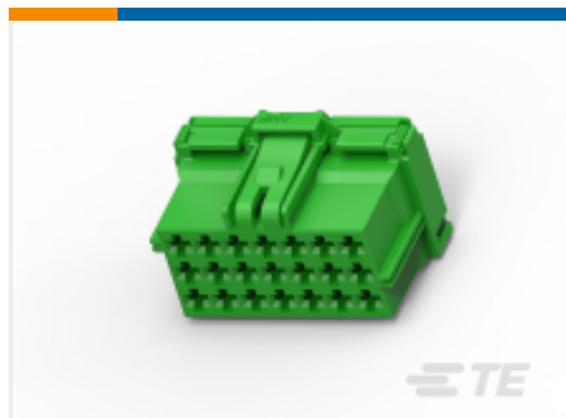
TE 产品编号2-1718353-2 AMP MCP, 非密封连接器壳体