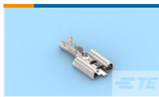
TE 产品编号444156-4 .250 FASTON REC.