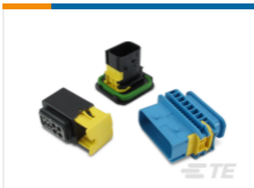
TE 产品编号3-1418480-1 重载密封连接器壳体