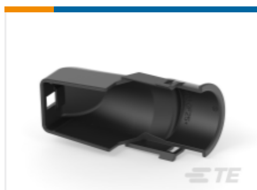
TE 产品编号2112452-2 COVER, FOR 22 POS