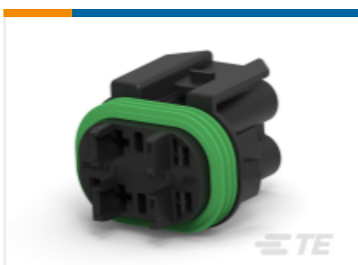
TE 产品编号2066046-3 2 POS MINI FUSE BOX ASSY