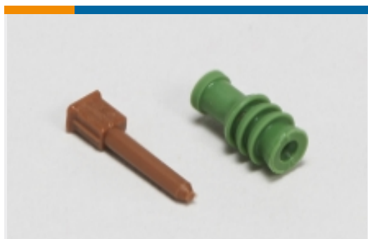
汽车密封件和盲堵(2)