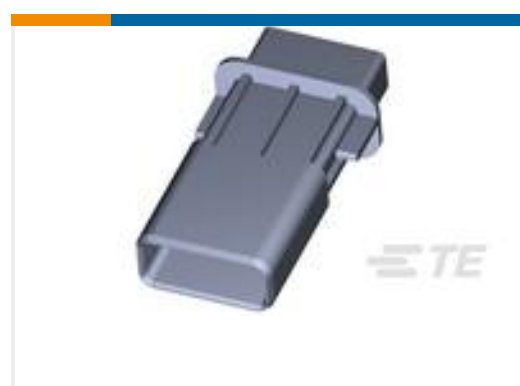
TE 产品编号2103321-1 3p Inner Hsg, Split Hdr, Key A, HVA280