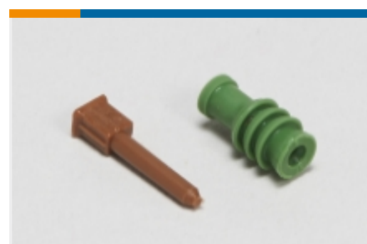
汽车密封件和盲堵(6)