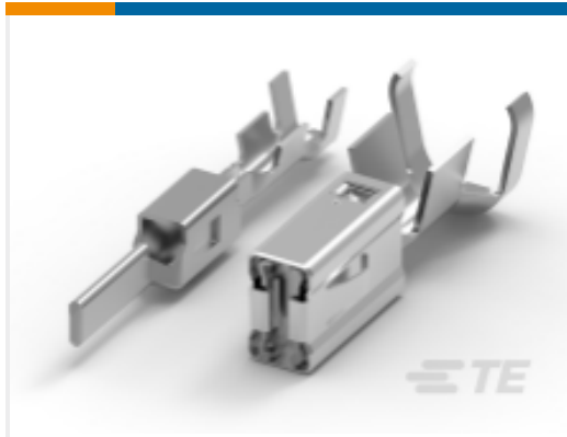
TE 产品编号 CAT-AM705-T273 AMP MCP，母端和公端