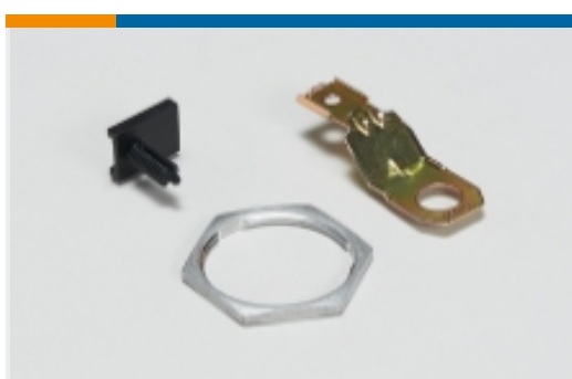
其他汽车连接器附件(2)