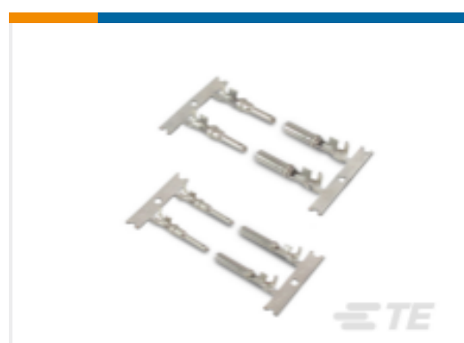
TE 产品编号1060-14-0122 DEUTSCH 冲压成型端子