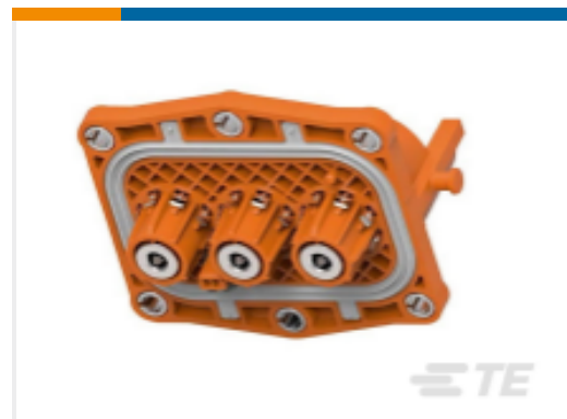
TE 产品编号2103247-1 高压接头