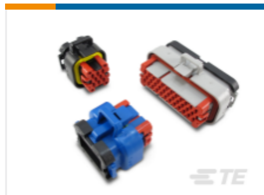
TE 产品编号770680-1 AMPSEAL 壳体