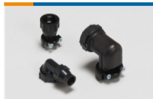
电路连接器后壳和夹具(56)