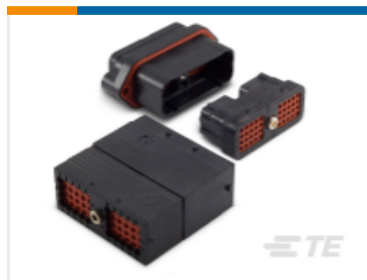
TE 产品编号DRC16-24SAE-P013 DEUTSCH DRC 壳体