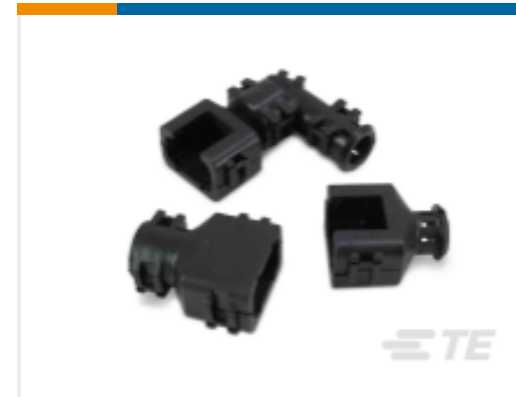
TE 产品编号1326979-1 AMPSEAL 16 后盖