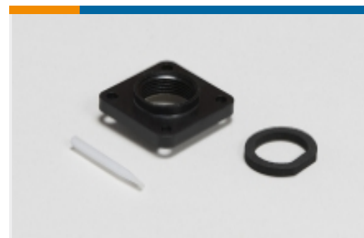
电路连接器密封件(36)