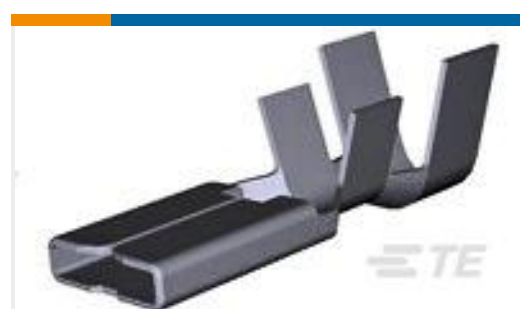
TE 产品编号1544228-1 CLIP 8 MM NG1-1 PO