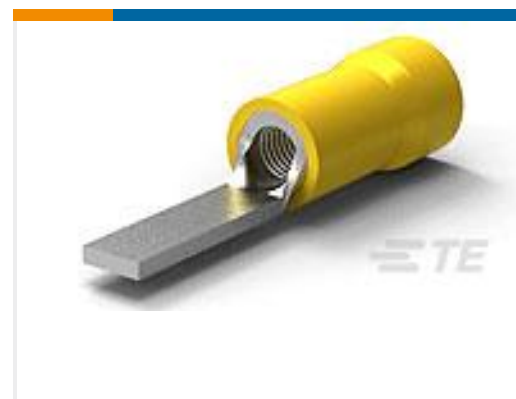
TE 产品编号131445 PG, WIRE TAB, 12-10