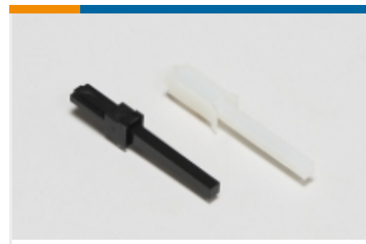
电路连接器键控插头(2)