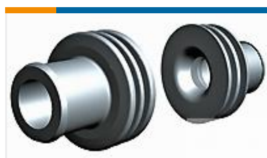
TE 产品编号1544316-2 JOINT ORANGE G3