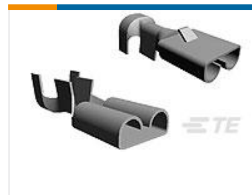
TE 产品编号160864-2 FF 110 REC TERMINAL 20-17 AWG PTPB