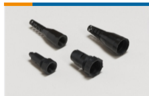
圆形连接器护套和应力消除(6)