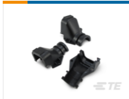
TE 产品编号1563110-1 重载密封连接器尾盖