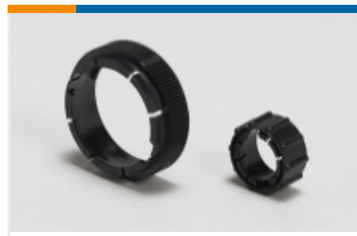
电路连接器适配器(7)