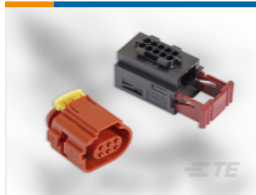
TE 产品编号1-967626-3 定时器，连接器壳体