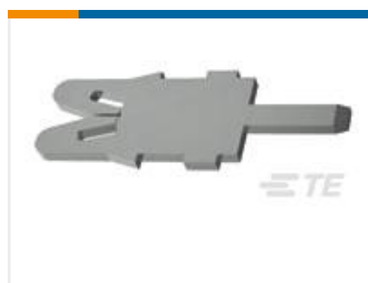
TE 产品编号1601128-4 TAB,PCB,FINE,SMZ