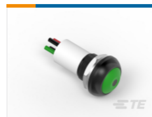
TE 产品编号1-2329388-7 PB OFF/ON FC GRE M1 TERM RED LED IP68 50