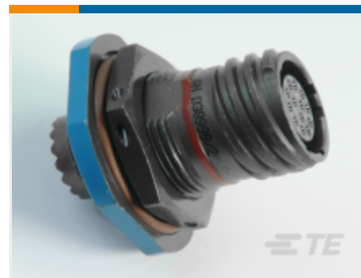
TE 产品编号YDTS24W21-35SCV001 Jam Nut: D38999, 21-35 Insert