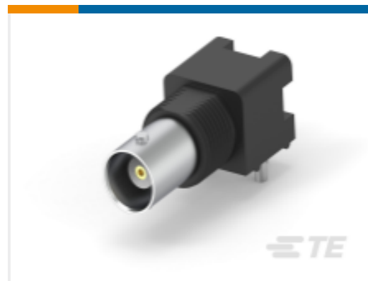
TE 产品编号1-5227161-8 BNC Right Angle M Jack RF Connector, 50 Ohm, Bayonet Coupling Mechanism