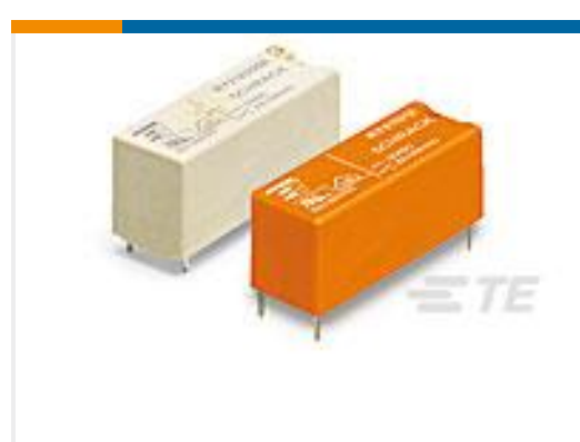
TE 产品编号3-1393225-4 RY613048