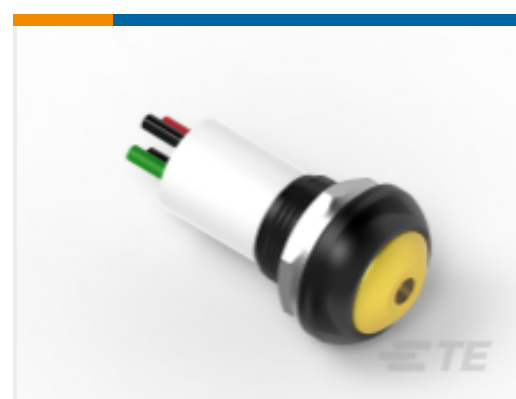
TE 产品编号1-2329388-2 PB OFF/ON FC YLW M1 TERM RED LED IP68 50