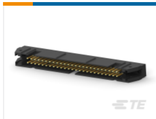
TE 产品编号5111008-1 AMP 锁门通用插头