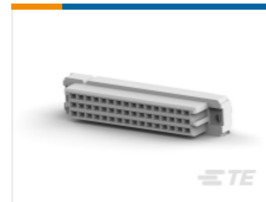
TE 产品编号1-5536397-5 ASSY,RECEPT,EURO,TYPE C/2,LEAD