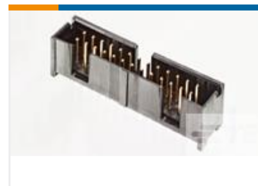
TE 产品编号1-5103309-0 A/L LOW PRO HDR 50P VERT BLACK