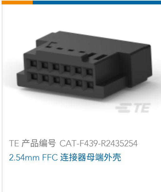
TE 产品编号 CAT-F439-R2435254 2.54mm FFC 连接器母端外壳