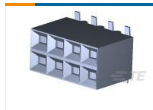
TE 产品编号147105-4 08 MODIV VRT DR SFMNT 30AU