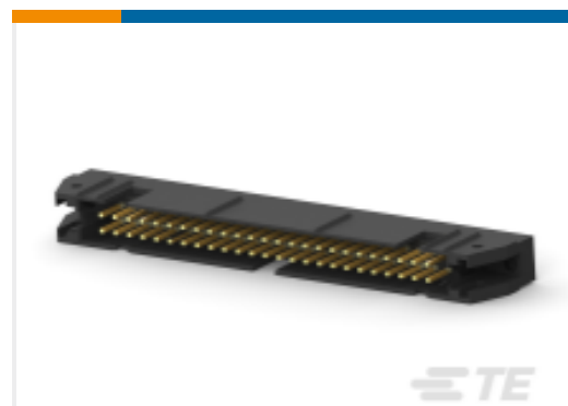
TE 产品编号 102156-1 AMP 锁门通用插头