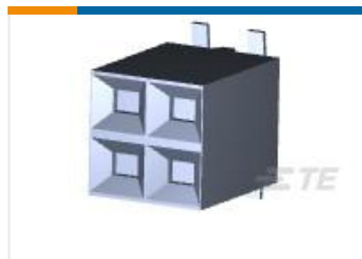
TE 产品编号 147105-2 04 MODIV VRT DR SFMNT 30AU