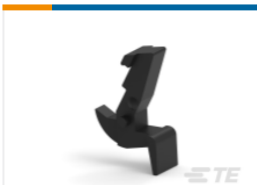
TE 产品编号102320-1 通用公端：弹射器锁门