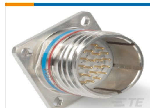
TE 产品编号YDTS20W25-43PBV001 D38999：方形凸缘，25-43 插件