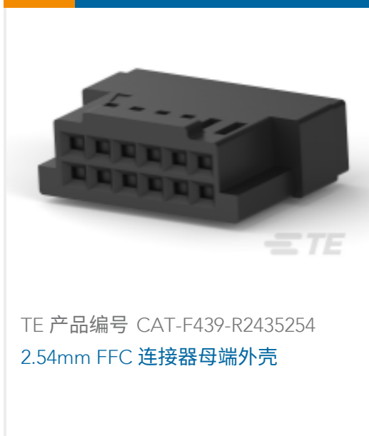
TE 产品编号 CAT-F439-R2435254 2.54mm FFC 连接器母端外壳