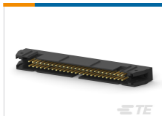
TE 产品编号1-499923-0 AMP 锁门通用插头