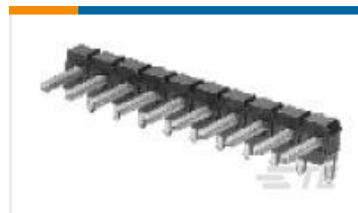
TE 产品编号102978-2 02 MODII HDR SRRRA B/A .100CL