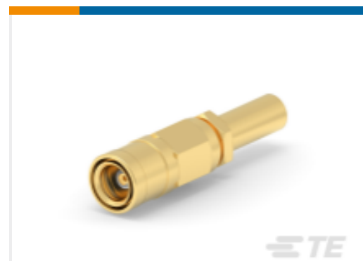
TE 产品编号1060368-1 SMB RF Connector: Female (Plug), Push-On, 50 Ohm