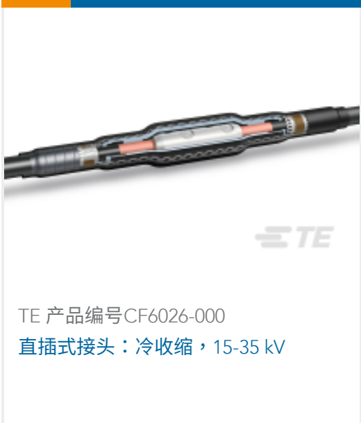
TE 产品编号CF6026-000 直插式接头：冷收缩，15-35 kV