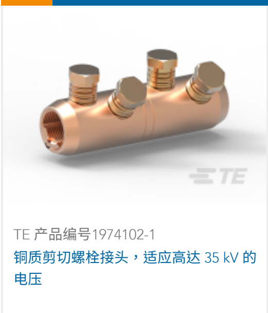
TE 产品编号1974102-1 铜质剪切螺栓接头，适应高达 35 kV 的电压