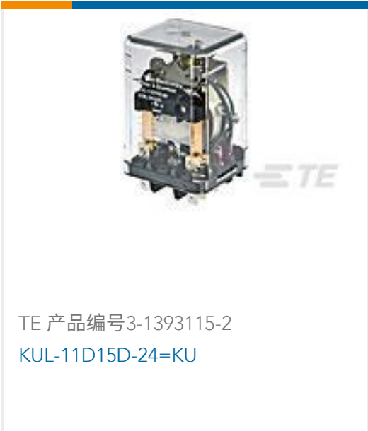
TE 产品编号3-1393115-2 KUL-11D15D-24=KU