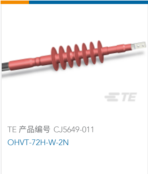
TE 产品编号 CJ5649-011 OHVT-72H-W-2N