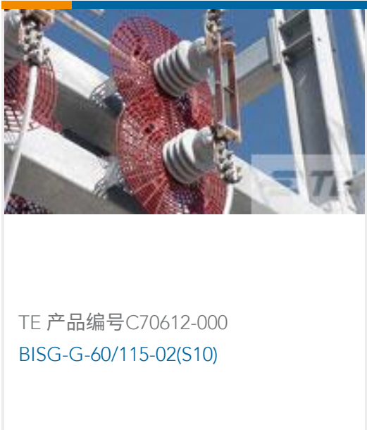
TE 产品编号C70612-000 BISG-G-60/115-02(S10)