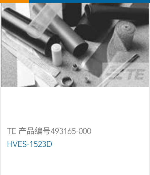
TE 产品编号493165-000 HVES-1523D