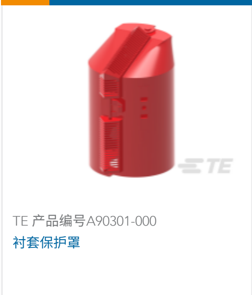
TE 产品编号A90301-000 衬套保护罩