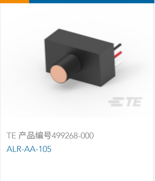
TE 产品编号499268-000 ALR-AA-105