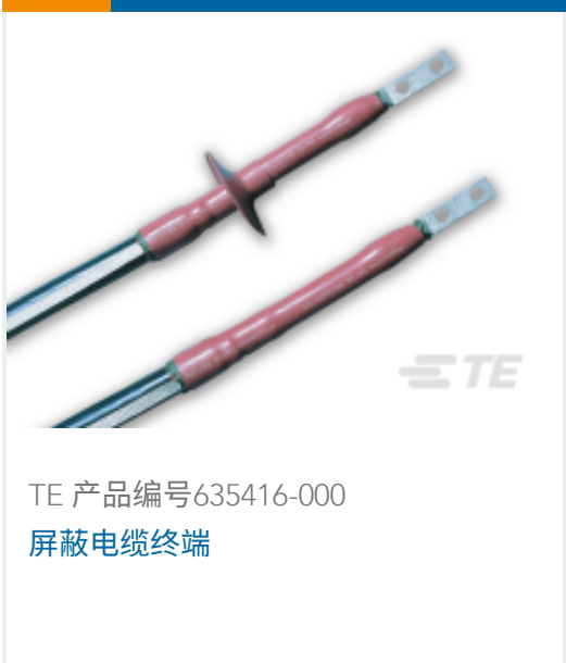
TE 产品编号635416-000 屏蔽电缆终端