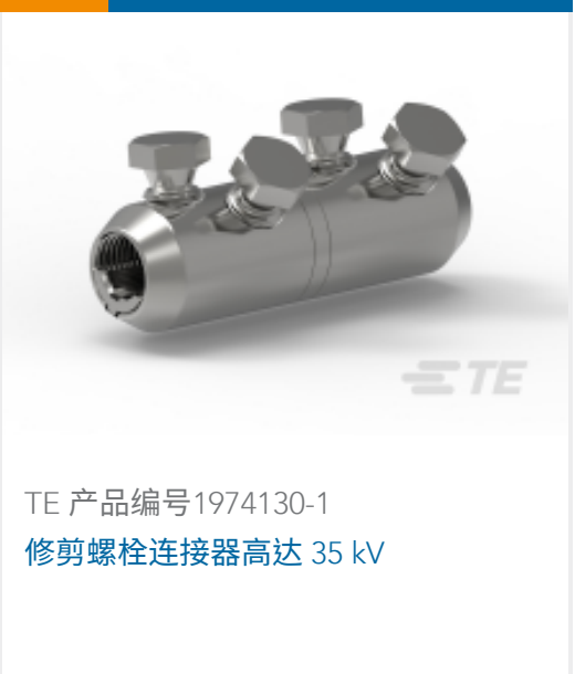
TE 产品编号1974130-1 修剪螺栓连接器高达 35 kV