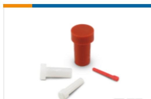
TE 产品编号114017-ZZ DEUTSCH 密封盲堵