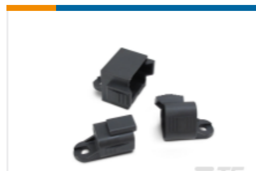
TE 产品编号1011-346-0405 DEUTSCH DT 防尘帽