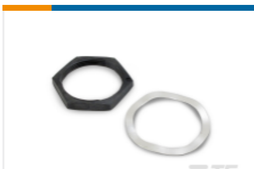
TE 产品编号2411-002-1805 DEUTSCH HDP20 安装硬件