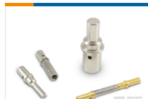
TE 产品编号0460-202-20141 DEUTSCH 实芯端子