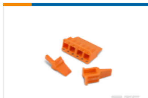
TE 产品编号WM-8S DEUTSCH DTM 楔形锁紧装置