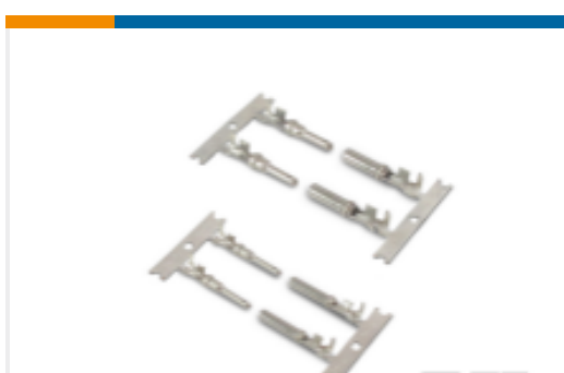
TE 产品编号1060-20-0222 DEUTSCH 冲压成型端子