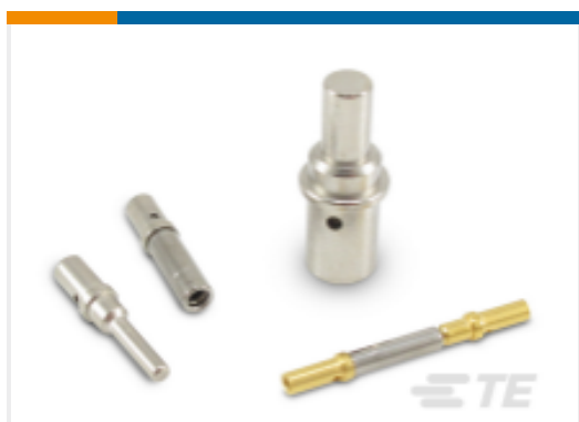
TE 产品编号0460-204-12141 DEUTSCH 实芯端子