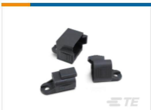
TE 产品编号1011-344-0205 DEUTSCH DT 防尘帽