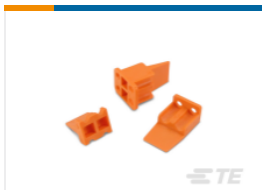
TE 产品编号WP-4S DEUTSCH DTP 楔形锁紧装置