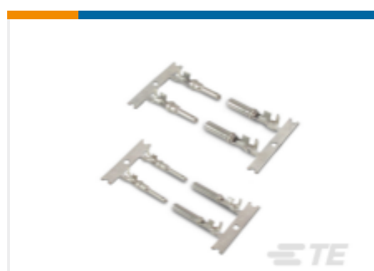
TE 产品编号1062-12-0222 DEUTSCH 冲压成型端子