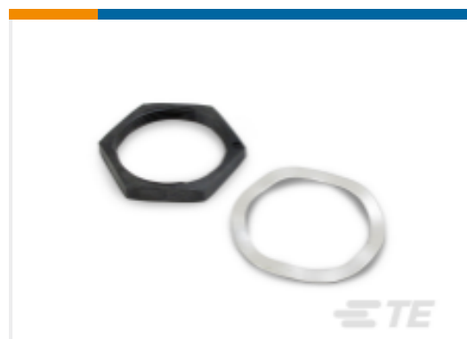
TE 产品编号2411-002-1805 DEUTSCH HDP20 安装硬件