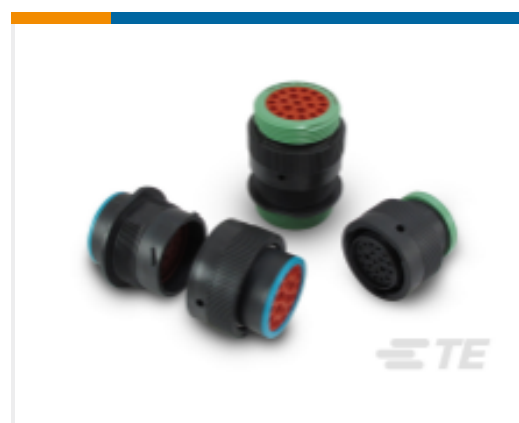
TE 产品编号YHDP26-24-35PEL017 DEUTSCH HDP20 壳体