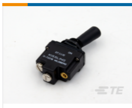
TE 产品编号K1007153 Toggle Switch 1-Pole, Sealed, Lever, Toggle, Plastic Lever