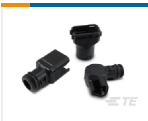
TE 产品编号1011-232-0305 DEUTSCH DT 后盖