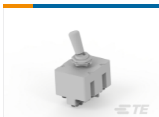
TE 产品编号K1002956 Toggle Switch 08-4-1-13