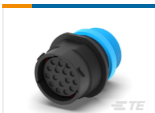
TE 产品编号HDP24-24-16SE-L015 REC, 16P, BLK, E, THD, 12, S