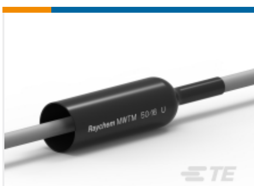
TE 产品编号834936-000 中厚壁热缩管