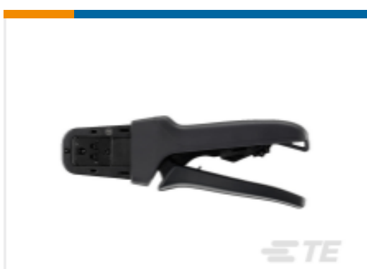
TE 产品编号DTT-20-03 CRIMP TOOL