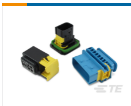
TE 产品编号2-1564532-1 重载密封连接器壳体