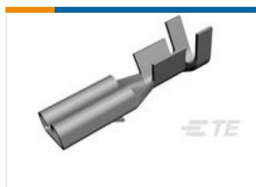
TE 产品编号160668-6 TERMINAL