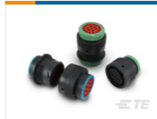
TE 产品编号YHDP26-24-35PEL017 DEUTSCH HDP20 壳体