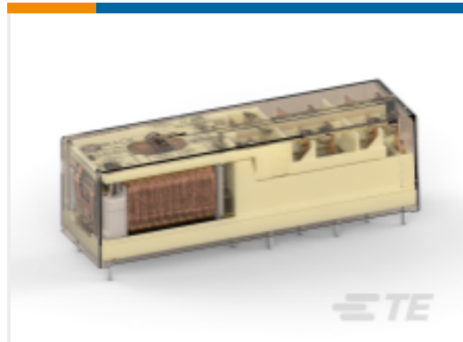
TE 产品编号1415015-1 增强绝缘强制导向继电器