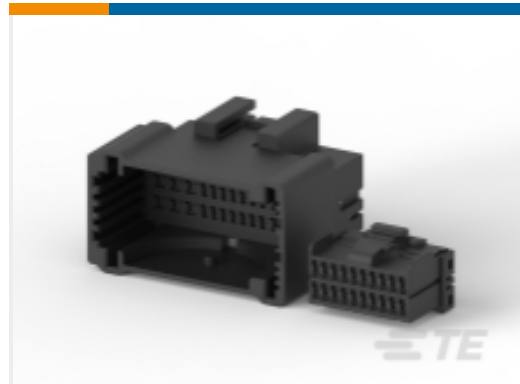
TE 产品编号1-174921-1 MULTILOCK, 连接器壳体