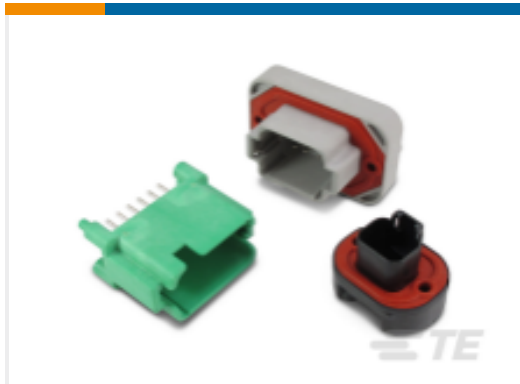
TE 产品编号DT13-2P DEUTSCH DT 接头