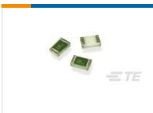
TE 产品编号1-2176088-7 RP 1J 0.166W 1K1 0.1% 25PPM 1K RL