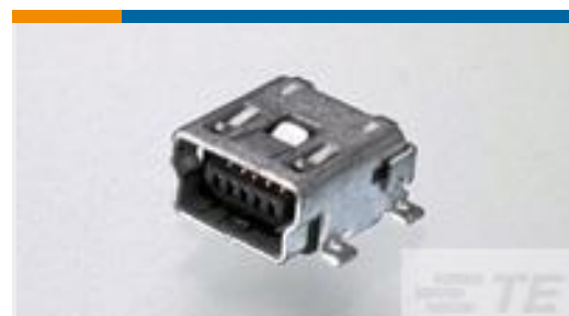
TE 产品编号1-1734035-1 MINI USB, TYPE B, R/A, SMT