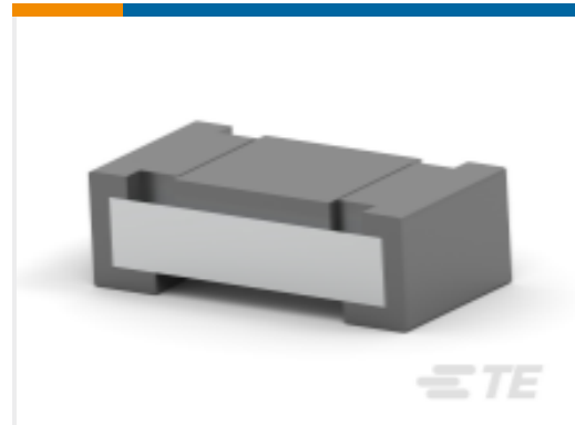
TE 产品编号1-2176057-3 厚膜电阻器: 电流感应