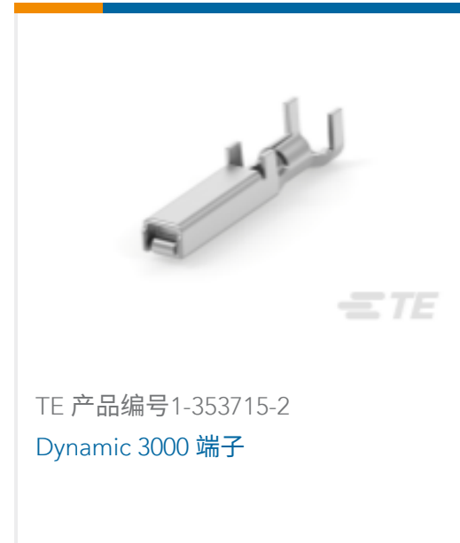
TE 产品编号1-353715-2 Dynamic 3000 端子