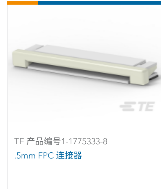
TE 产品编号1-1775333-8 .5mm FPC 连接器