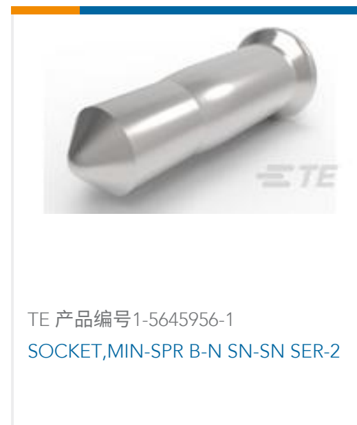
TE 产品编号1-5645956-1 SOCKET,MIN-SPR B-N SN-SN SER-2