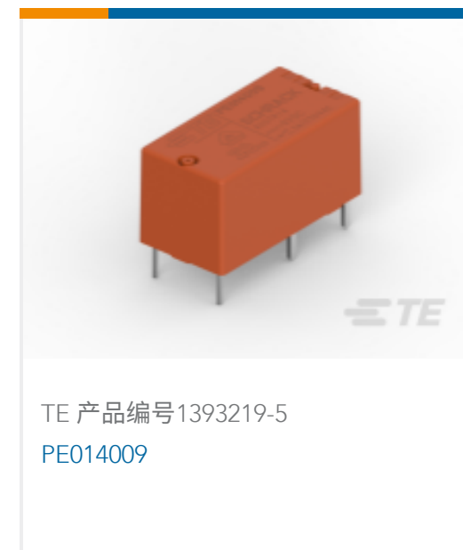
TE 产品编号1393219-5 PE014009