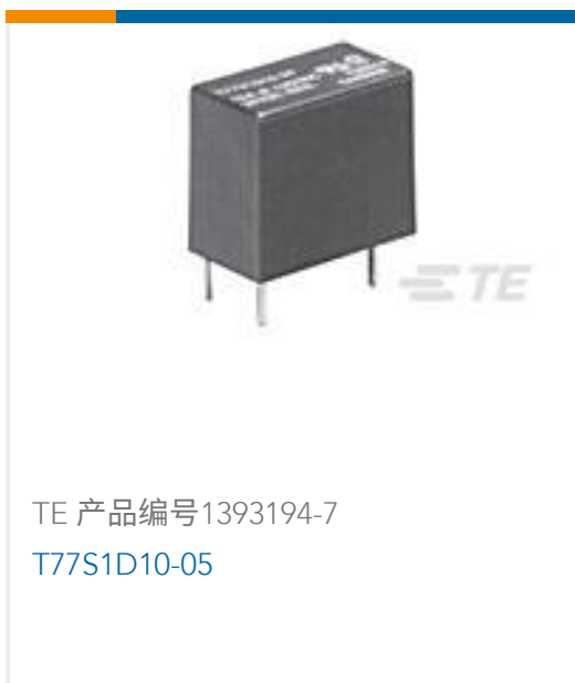
TE 产品编号1393194-7 T77S1D10-05