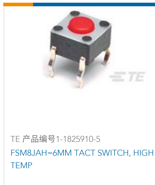
TE 产品编号1-1825910-5 FSM8JAH=6MM TACT SWITCH, HIGH TEMP