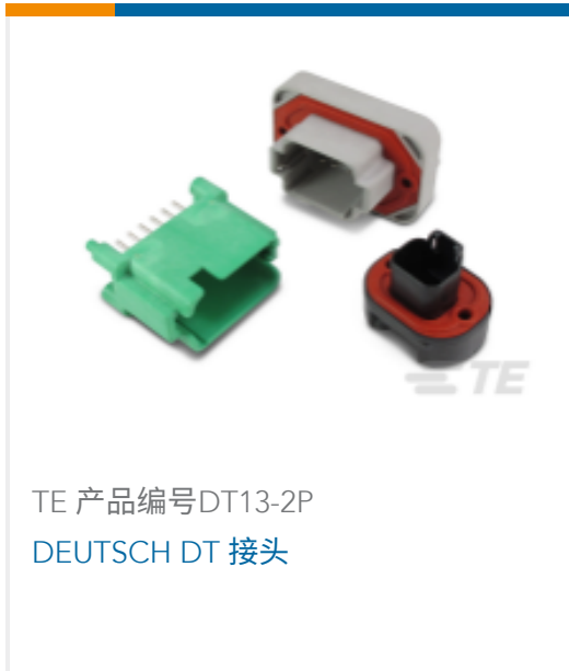
TE 产品编号DT13-2P DEUTSCH DT 接头