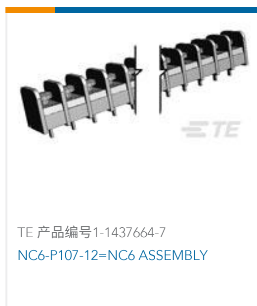
TE 产品编号1-1437664-7 NC6-P107-12=NC6 ASSEMBLY