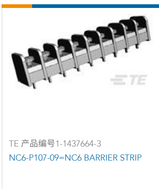
TE 产品编号1-1437664-3 NC6-P107-09=NC6 BARRIER STRIP