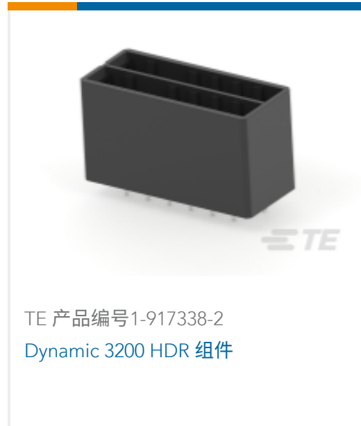
TE 产品编号1-917338-2 Dynamic 3200 HDR 组件