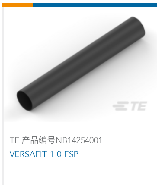
TE 产品编号NB14254001 VERSAFIT-1-0-FSP