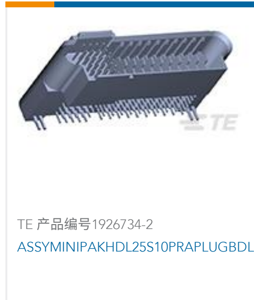
TE 产品编号1926734-2 ASSYMINIPAKHDL25S10PRAPLUGBDLCK