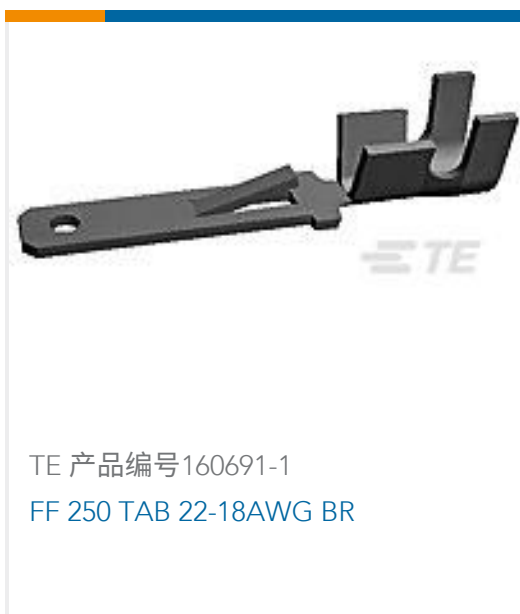
TE 产品编号160691-1 FF 250 TAB 22-18AWG BR