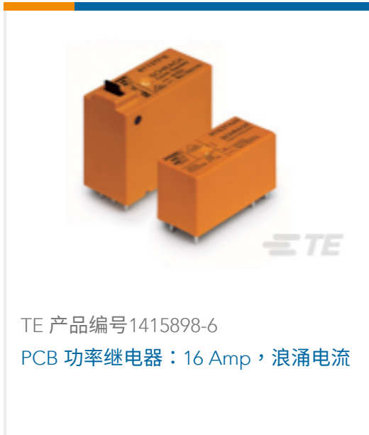
TE 产品编号1415898-6 PCB 功率继电器 : 16 Amp , 浪涌电流