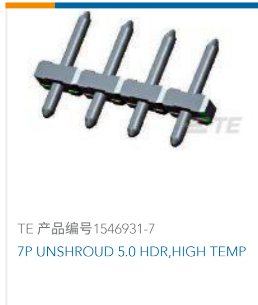
TE 产品编号1546931-7 7P UNSHROUD 5.0 HDR,HIGH TEMP