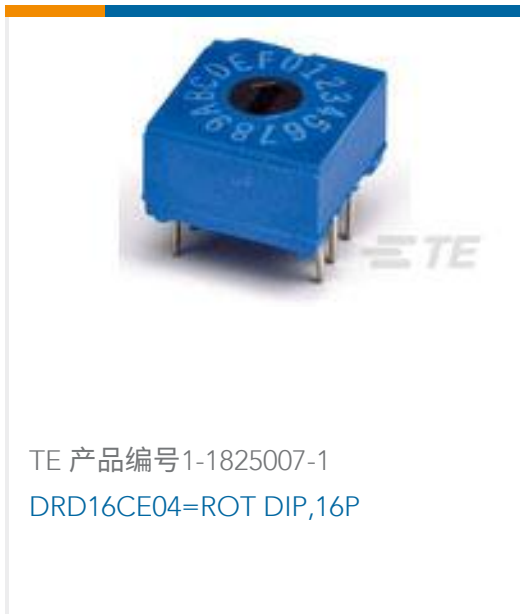
TE 产品编号1-1825007-1 DRD16CE04=ROT DIP,16P