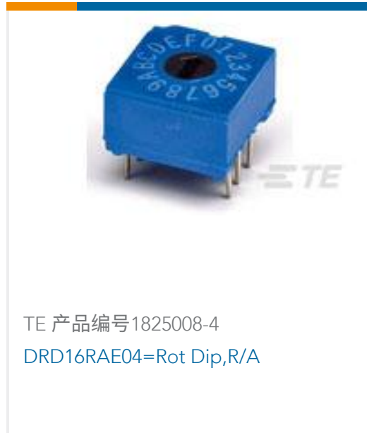
TE 产品编号1825008-4 DRD16RAE04=Rot Dip,R/A