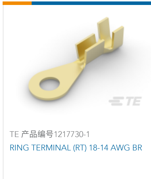
TE 产品编号1217730-1 RING TERMINAL (RT) 18-14 AWG BR