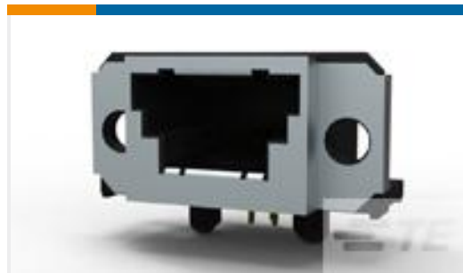
TE 产品编号1-1761182-1 4 SDL SE RCPT ASSY