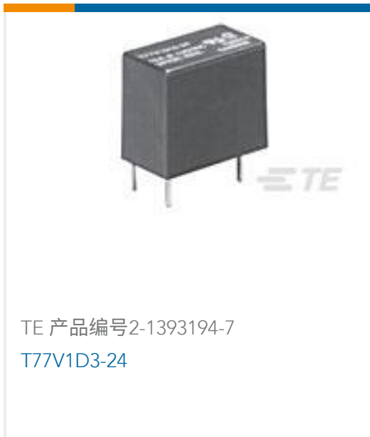
TE 产品编号2-1393194-7 T77V1D3-24