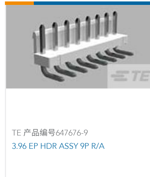
TE 产品编号647676-9 3.96 EP HDR ASSY 9P R/A