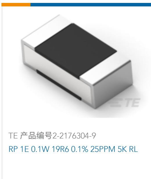
TE 产品编号2-2176304-9 RP 1E 0.1W 19R6 0.1% 25PPM 5K RL