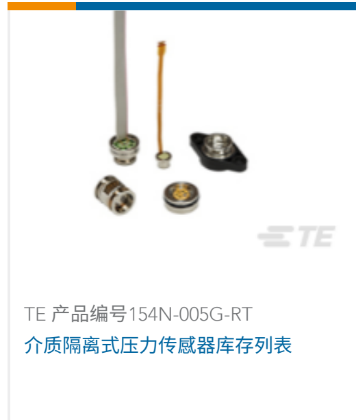
TE 产品编号154N-005G-RT 介质隔离式压力传感器库存列表