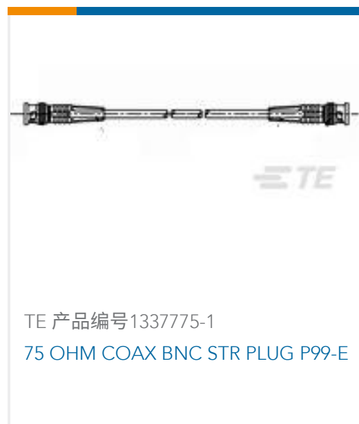
TE 产品编号1337775-1 75 OHM COAX BNC STR PLUG P99-E