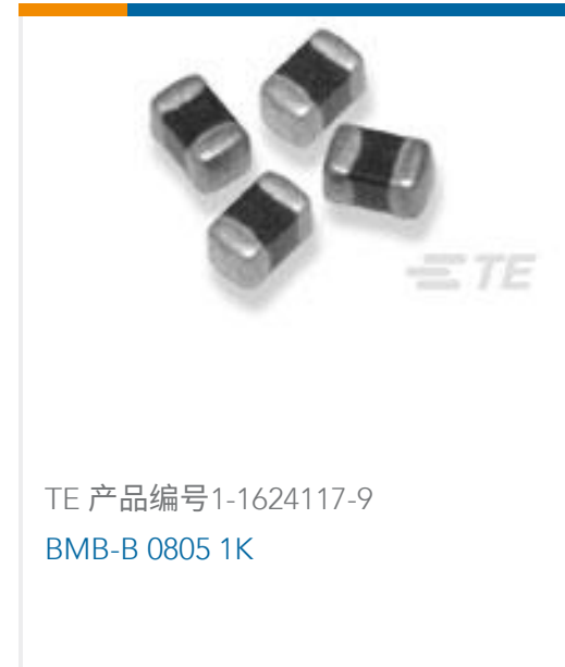
TE 产品编号1-1624117-9 BMB-B 0805 1K