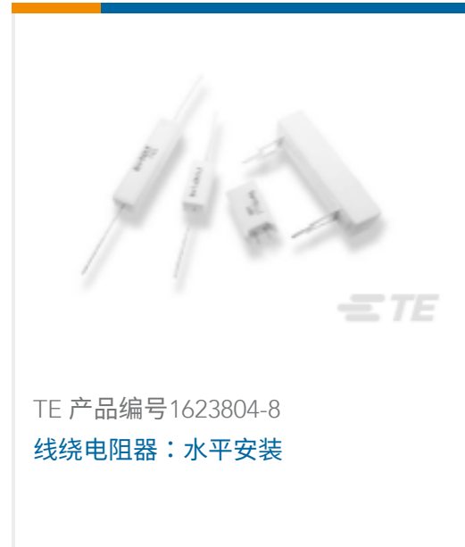
TE 产品编号1623804-8 线绕电阻器：水平安装