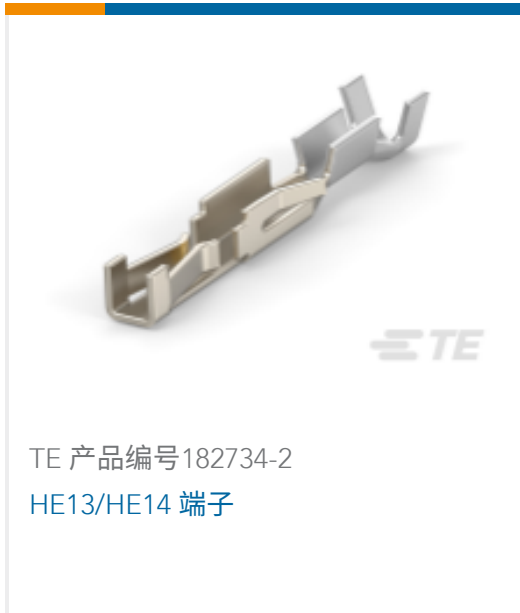
TE 产品编号182734-2 HE13/HE14 端子