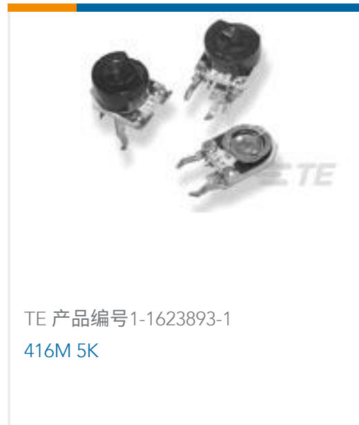
TE 产品编号1-1623893-1 416M 5K