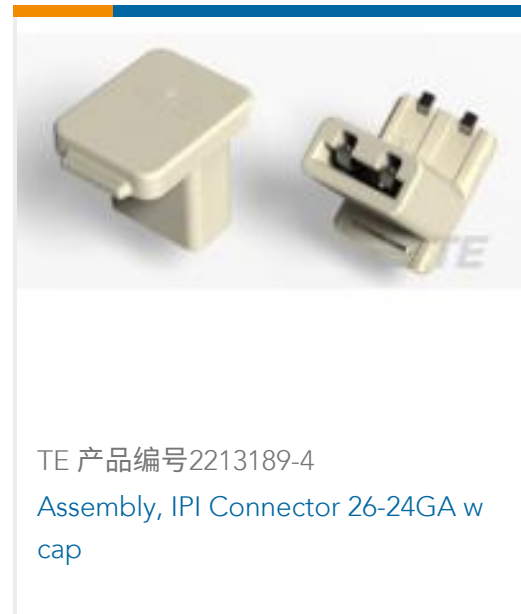
TE 产品编号2213189-4 Assembly, IPI Connector 26-24GA w cap