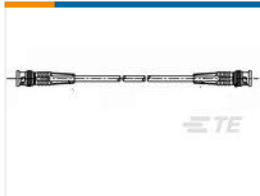
TE 产品编号1337771-4 50 OHM COAX BNC STR PLUG STR P