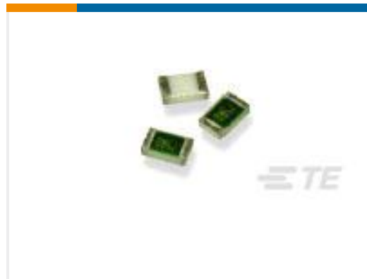
TE 产品编号1-2176217-8 CPF A 0805 82R 0.1% 25PPM 1K RL