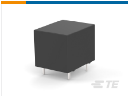
TE 产品编号1-1721150-0 ORWH 10 AMP PCB 继电器