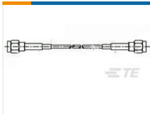
TE 产品编号1337808-2 50 OHM COAX SMA STR PLUG STR P