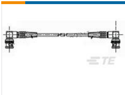
TE 产品编号1337773-1 50/OHM COAX BNC ELB PLUG ELB P