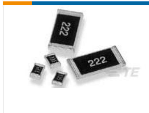
TE 产品编号1-2176186-9 CRGH1206 1% 3K9 0.5W