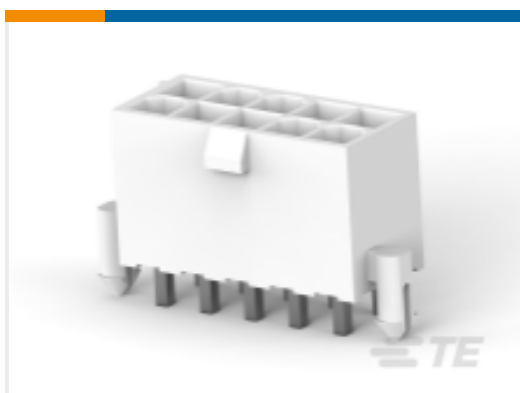
TE 产品编号1-2825261-0 10P VAL-U-LOK HCS VRT HDR W/P V0