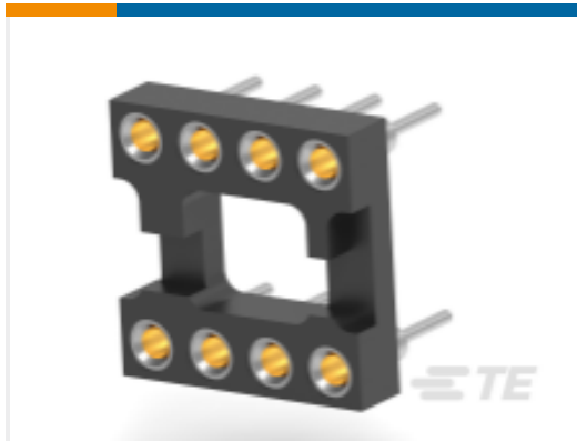
TE 产品编号1-2199299-2 DIP Socket: Standard, Stamped & Formed, Open, Tin