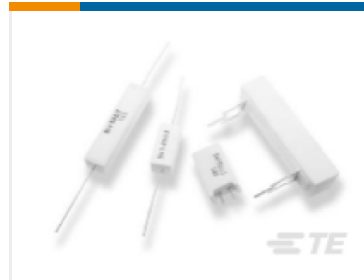
TE 产品编号1623783-7 线绕电阻器：垂直安装