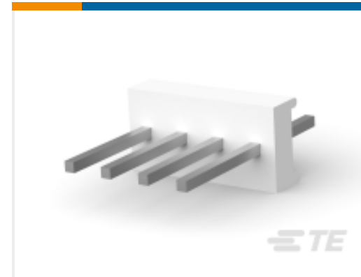
TE 产品编号1-640456-2 Polyester Vertical PCB Header: 2.54 mm, Unshrouded, No Mating Alignment