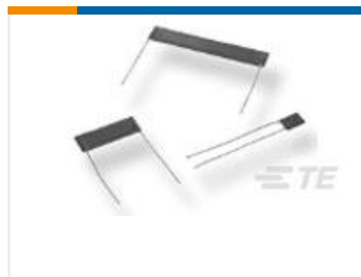
TE 产品编号1625959-6 HB03RE 10M 1% 100PPM