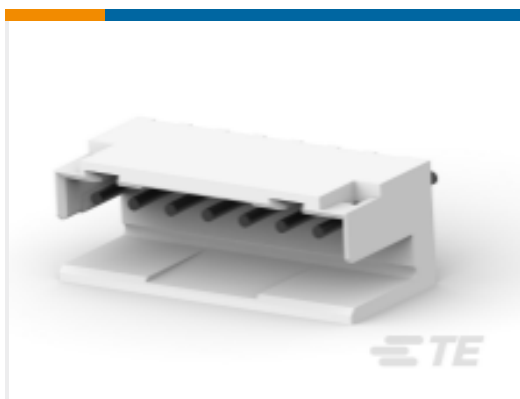
TE 产品编号1-292173-2 AMP 通用终端接头