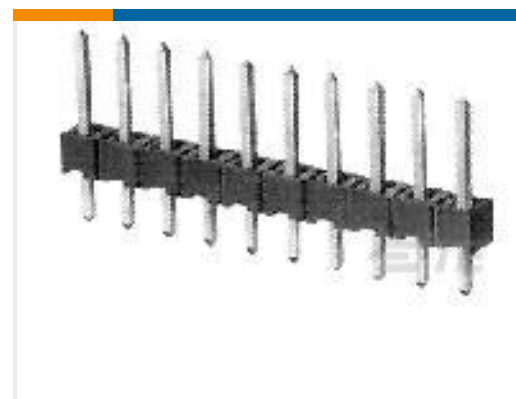
TE 产品编号826646-9 9P AMPMODU II STIFT LEI