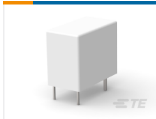
TE 产品编号1461400-5 STD OEG 小型 PCB OJ/OJE Pow 继电器