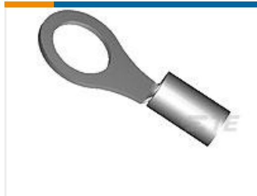
TE 产品编号321875 TERMINAL,SOLIS R 3/0 3/8