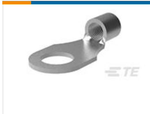
TE 产品编号320383 TERMINAL,SOLIS R 2 1/4