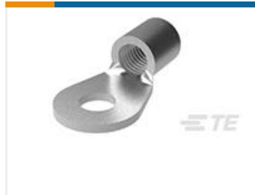
TE 产品编号33465 TERMINAL,SOLIS R 6 1/4