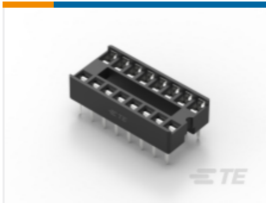
TE 产品编号1-2199298-4 DIP Socket: Low Profile, Stamped & Formed, Open, Tin