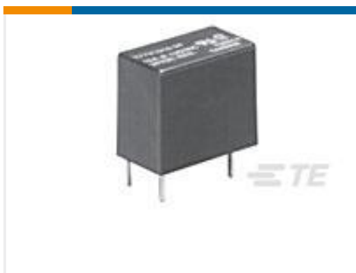
TE 产品编号2-1393194-6 T77V1D3-12