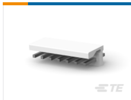
TE 产品编号1744194-7 07P MTA156 HDR ASSY FL/STR SN