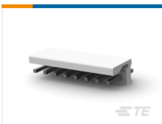
TE 产品编号1744194-8 08P MTA156 HDR ASSY FL/STR SN