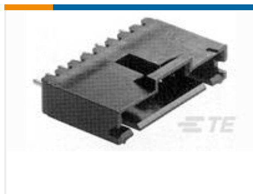
TE 产品编号147574-2 13 MTE HDR W/O SWAGE S.LOAD