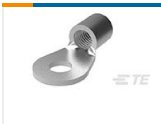
TE 产品编号321866 BODY SOLIS RING 1/0 1/4