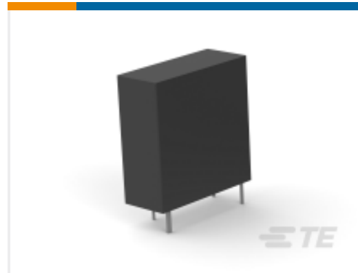
TE 产品编号1-1419126-8 STD OEG PCB PCFN 太阳能继电器