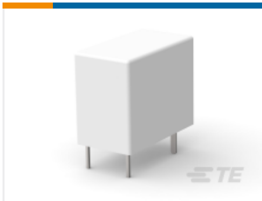
TE 产品编号1461403-5 STD OEG 小型 PCB OJ/OJE Pow 继电器