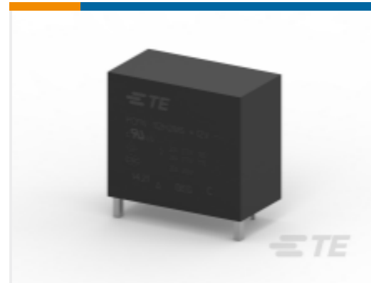
TE 产品编号9-1440003-5 PCFN 太阳能继电器