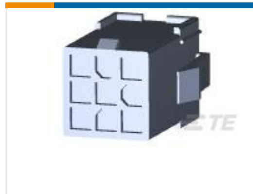
TE 产品编号1-172161-9 MINI UNIVERSAL M-N-L CAP 9P