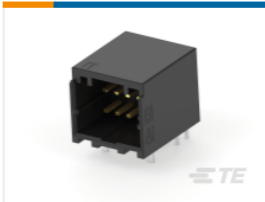
TE 产品编号1-1827872-0 Dynamic 1100 HDR 组件