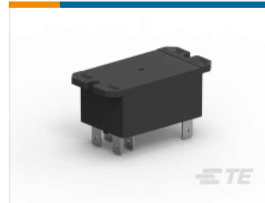
TE 产品编号1-1423008-8 PCB 功率继电器：40 Amp，单稳