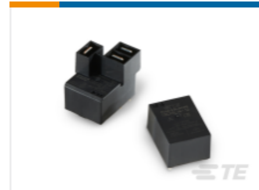
TE 产品编号1558662-4 PCB 功率继电器：30 安培，单稳直流系统