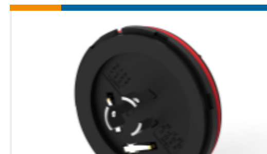
TE 产品编号1-2336396-1 ASSEMBLY, LIGHT CONTROLLER BASE, W/VENT