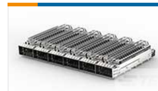
TE 产品编号2-2170708-1 CAGE ASSY, 1X6, QSFP28, SPRING, HS, LP