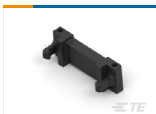
TE 产品编号111547-7 插针连接器：应力消除，通用