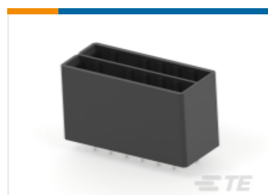
TE 产品编号2-179277-5 Dynamic 3200 HDR 组件