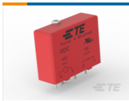
TE 产品编号 CAT-P851-OD1 P&B SSR 输出直流模块