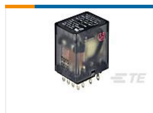
TE 产品编号2-1393122-6 KHAU-17A11N-120-KH