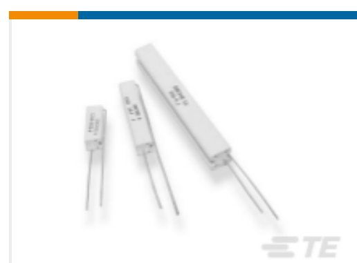
TE 产品编号1-1623733-1 线绕电阻器：垂直安装