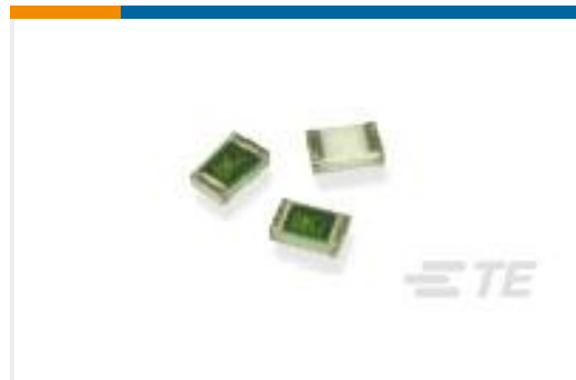
TE 产品编号1676142-1 RN 0805 100K 0.1% 10PPM CUT LENGTH