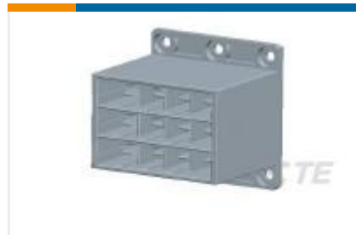
TE 产品编号1903146-2 DYNAMIC D-5 DYNATAP 12P ASSY P /M BOTTOM