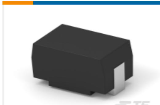
TE 产品编号2-1879234-3 SMD 功率电阻器：7 瓦特，200-2M 欧姆