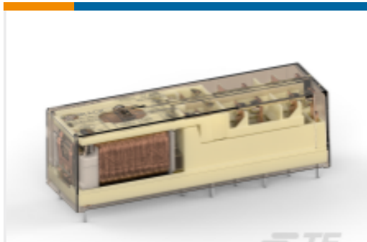
TE 产品编号1415015-1 增强绝缘强制导向继电器