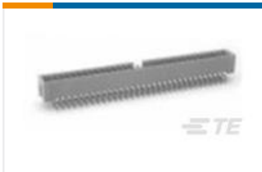
TE 产品编号2-1761605-3 IDC LOW PRO HDR 10P RA BLUE