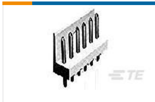
TE 产品编号173081-4 4P EIS POST HDR ASSY