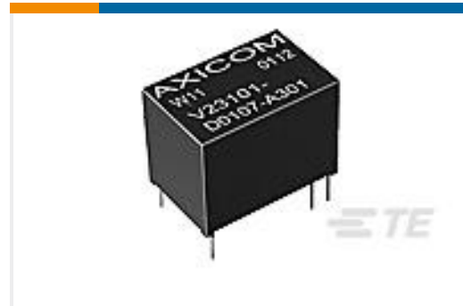
TE 产品编号1-1393779-8 V23101D 7A201