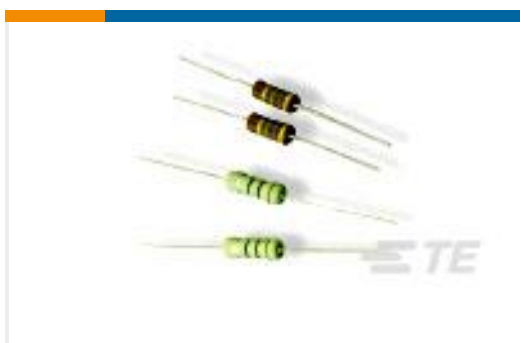
TE 产品编号2-1625875-2 CBT 1/4 5% 2K2