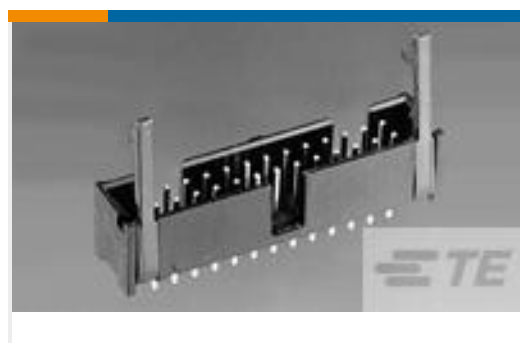
TE 产品编号2-1761609-9 IDC LOW PRO HDR 26P RA SHT LAT