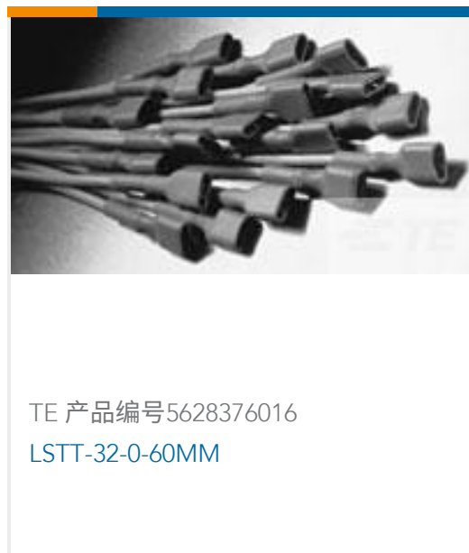
TE 产品编号5628376016 LSTT-32-0-60MM