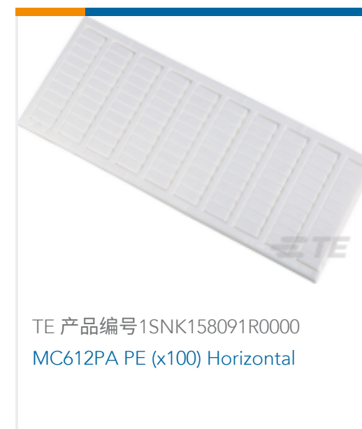
TE 产品编号1SNK158091R0000 MC612PA PE (x100) Horizontal