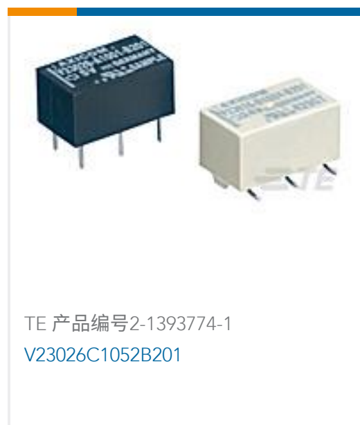
TE 产品编号2-1393774-1 V23026C1052B201