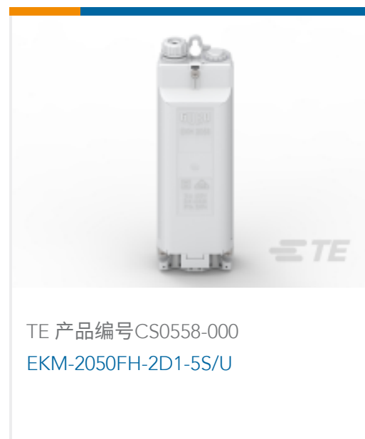
TE 产品编号CS0558-000 EKM-2050FH-2D1-5S/U