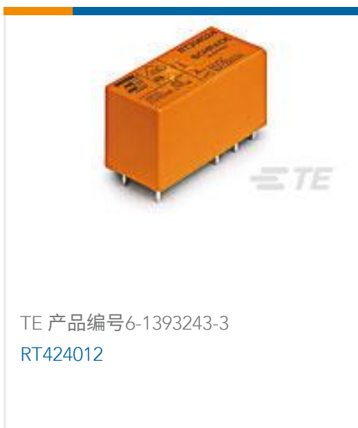
TE 产品编号6-1393243-3 RT424012