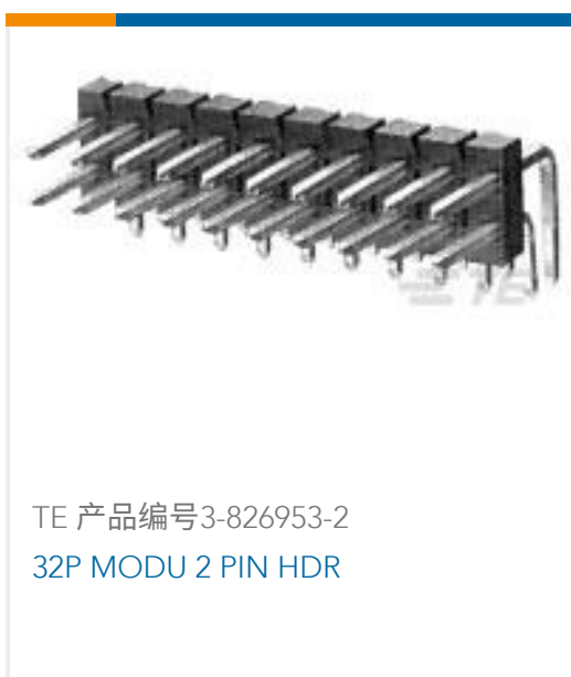
TE 产品编号3-826953-2 32P MODU 2 PIN HDR