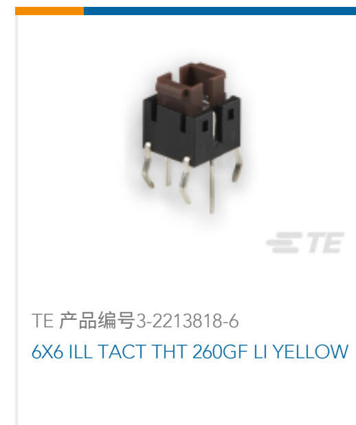
TE 产品编号3-2213818-6 6X6 ILL TACT THT 260GF LI YELLOW