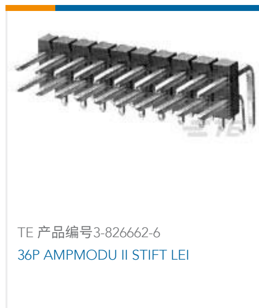
TE 产品编号3-826662-6 36P AMPMODU II STIFT LEI