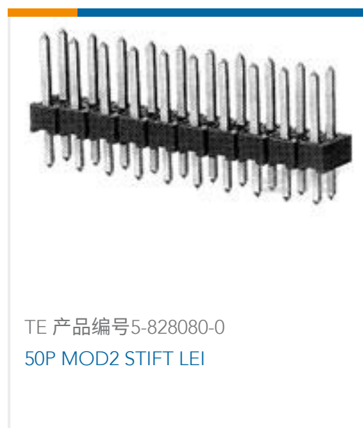
TE 产品编号5-828080-0 50P MOD2 STIFT LEI