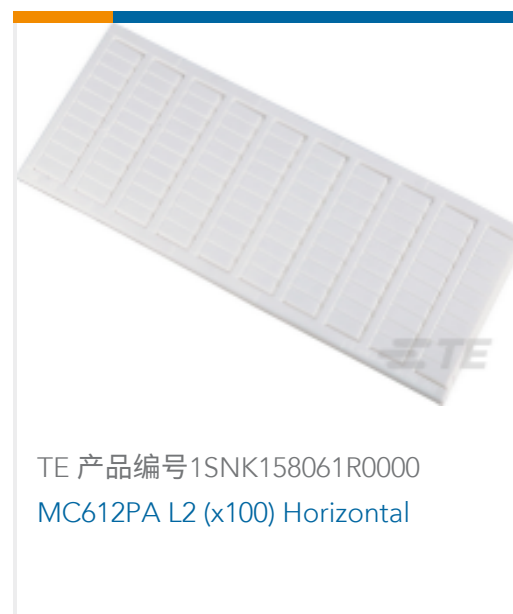
TE 产品编号1SNK158061R0000 MC612PA L2 (x100) Horizontal