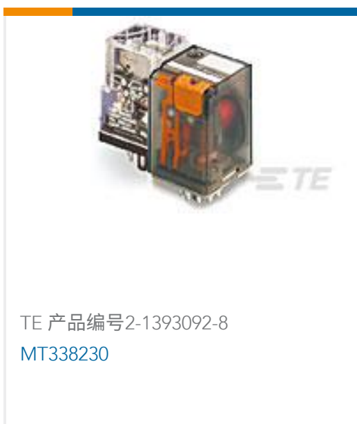
TE 产品编号2-1393092-8 MT338230