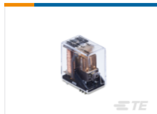
TE 产品编号2-1393809-2 信号继电器：5 安培，单稳直流