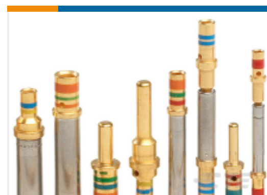
TE 产品编号1841-1-5620 CONT PIN