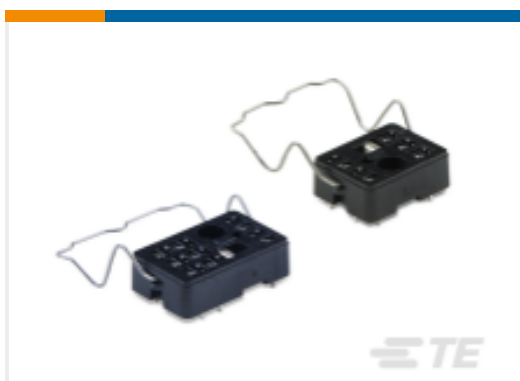
TE 产品编号1393824-5 CRADLE 继电器附件