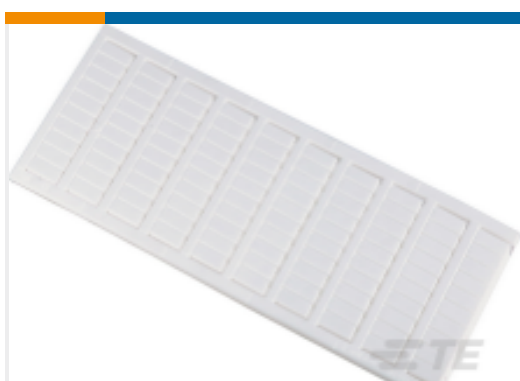
TE 产品编号1SNK158091R0000 MC612PA PE (x100) Horizontal