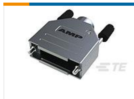
TE 产品编号1478762-9 METAL BACKSHELL 9 WAY TOP E