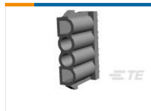
TE 产品编号173926-1 4 P ACTION PIN UMNL