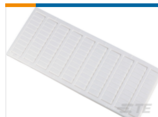
TE 产品编号1SNK158061R0000 MC612PA L2 (x100) Horizontal