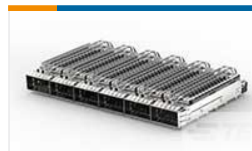
TE 产品编号2-2170708-1 CAGE ASSY, 1X6, QSFP28, SPRING, HS, LP