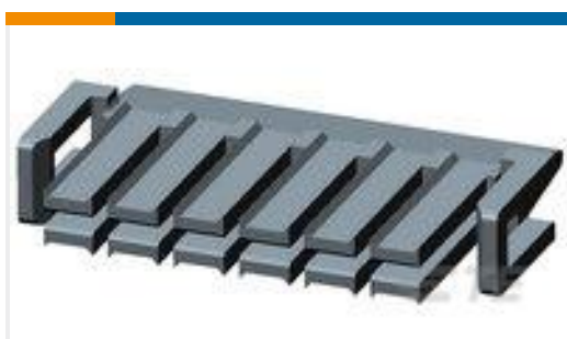
TE 产品编号2-1969541-8 RETAINER, TPA, DUAL ROW, EP2.5