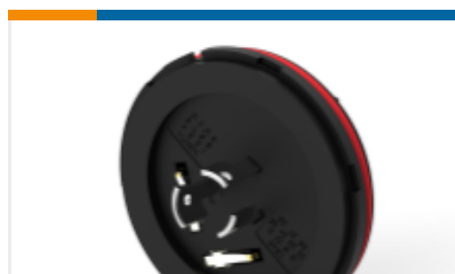
TE 产品编号1-2336396-1 ASSEMBLY, LIGHT CONTROLLER BASE, W/VENT