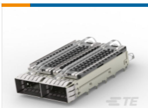
TE 产品编号2170808-1 QSFP28, 1X2, CAGE ASSY, SPRING, HS, LP