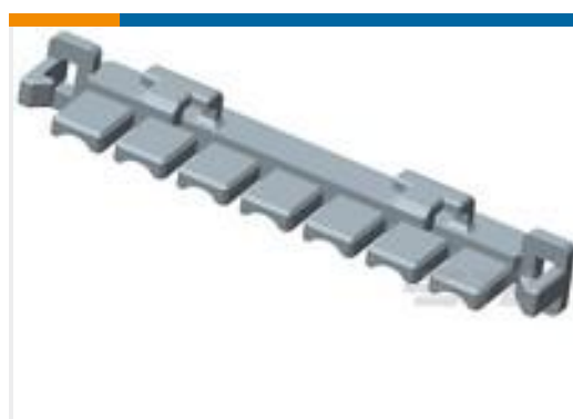
TE 产品编号1-1969609-2 12P VAL-U-LOK TPA 26-22 AWG