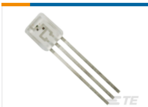
TE 产品编号11032254-00 光电发射器组件