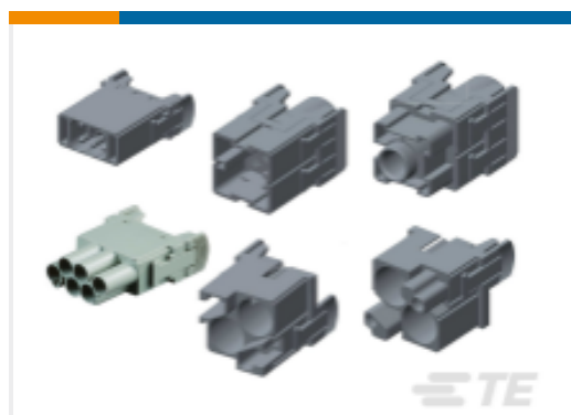
TE 产品编号T2111092201-007 HDC HMN - 符合铁路标准的模块化系统