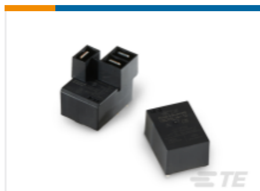
TE 产品编号1558662-4 PCB 功率继电器：30 安培，单稳直流系统