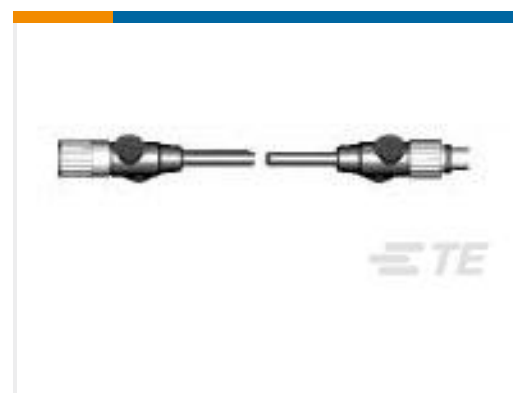
TE 产品编号3-1437720-1 T01-0599-B05-B=INDUSTRIAL CONN