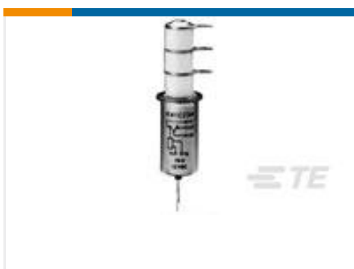
TE 产品编号5-1618239-5 K41C832=RELAY, VACUUM, SPDT