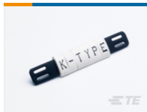
TE 产品编号EC6501-000 K-TYPE 捆绑式标志