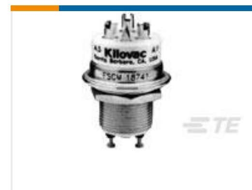
TE 产品编号3-1618274-6 HC-3=RELAY, VACUUM, SPDT