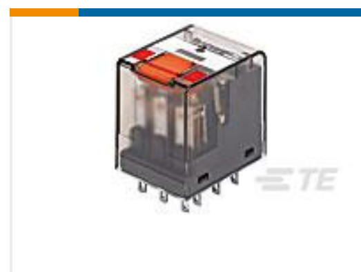
TE 产品编号1393154-9 PT380024