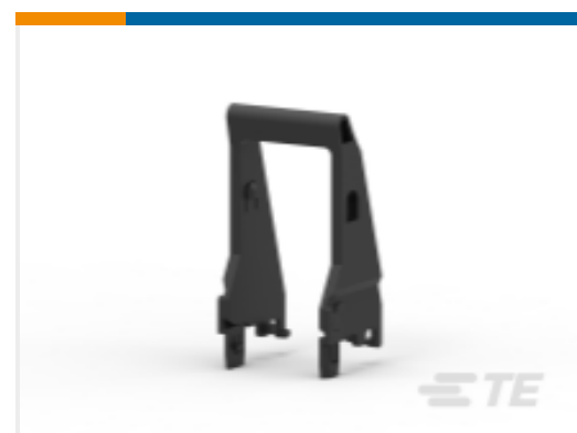
TE 产品编号1816124-1 PT17024