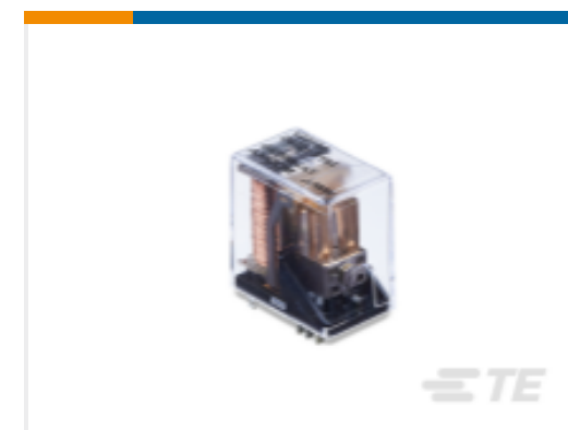
TE 产品编号4-1393809-4 信号继电器：5 安培，单稳直流