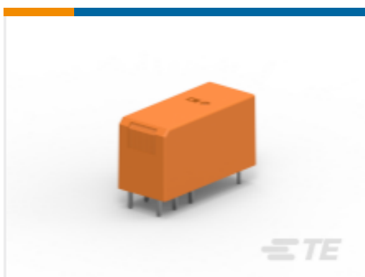
TE 产品编号7-1415899-6 PCB 功率继电器：12-16 Amp，单稳