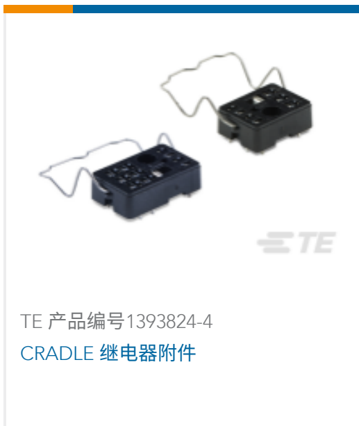
TE 产品编号1393824-4 CRADLE 继电器附件