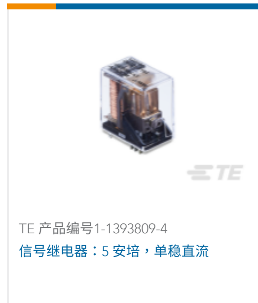
TE 产品编号1-1393809-4 信号继电器：5 安培，单稳直流