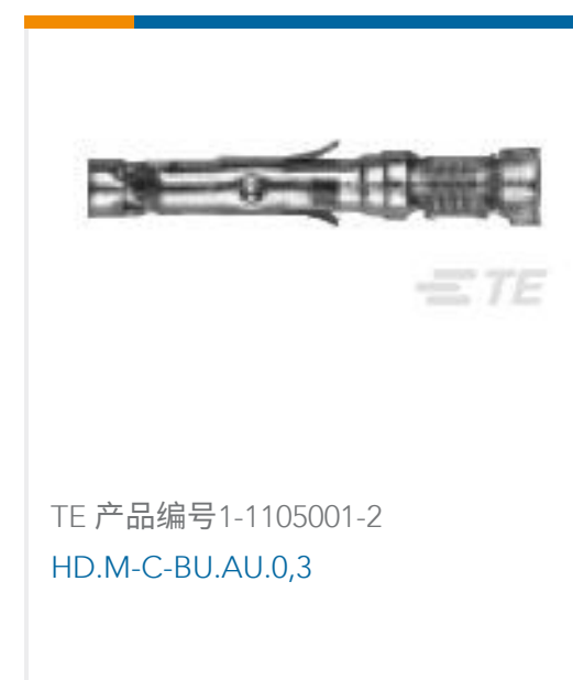
TE 产品编号1-1105001-2 HD.M-C-BU.AU.0,3