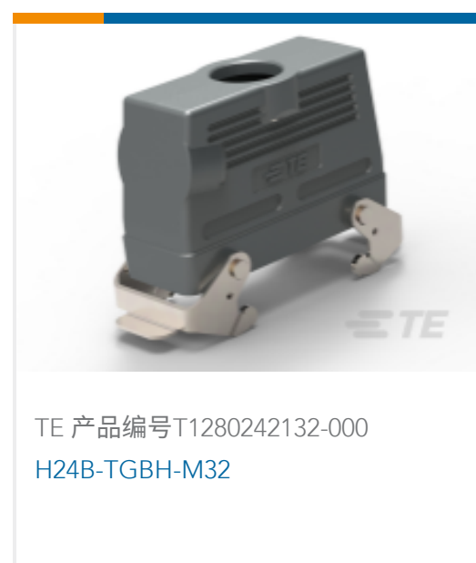
TE 产品编号T1280242132-000 H24B-TGBH-M32