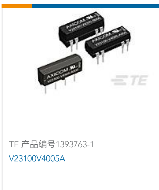
TE 产品编号1393763-1 V23100V4005A