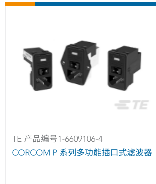
TE 产品编号1-6609106-4 CORCOM P 系列多功能插口式滤波器