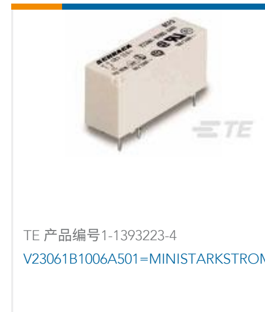
TE 产品编号1-1393223-4 V23061B1006A501=MINISTARKSTROM