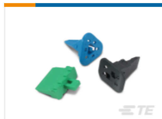
TE 产品编号W6P DEUTSCH DT 楔形锁紧装置