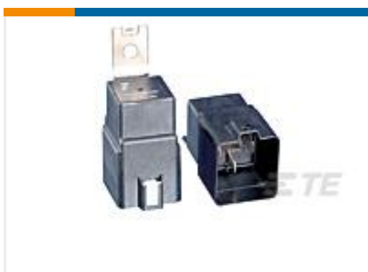
TE 产品编号1-1414122-0 V23136J1004X050-EV-CBOX