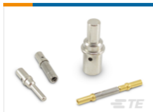
TE 产品编号0462-201-20141 DEUTSCH 实芯端子