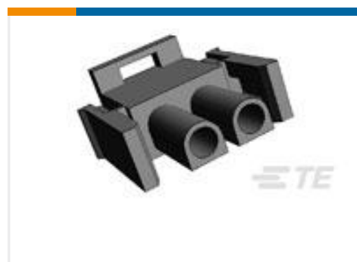
TE 产品编号1-480698-0 02P UMNL PLUG HSG NATL