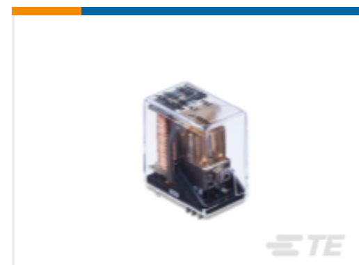
TE 产品编号1-1393811-1 信号继电器：5 安培，单稳直流