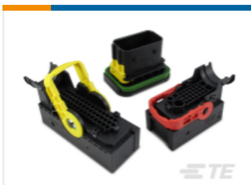
TE 产品编号1-1823449-1 LEAVYSEAL 壳体