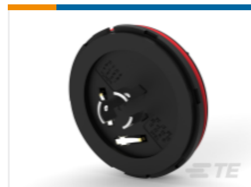
TE 产品编号1-2336396-1 ASSEMBLY, LIGHT CONTROLLER BASE, W/VENT