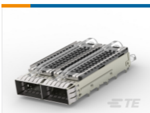
TE 产品编号2170808-1 QSFP28, 1X2, CAGE ASSY, SPRING, HS, LP