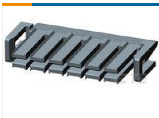
TE 产品编号2-1969541-8 RETAINER, TPA, DUAL ROW, EP2.5