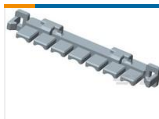
TE 产品编号1-1969609-2 12P VAL-U-LOK TPA 26-22 AWG