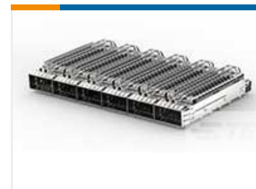
TE 产品编号2-2170708-1 CAGE ASSY, 1X6, QSFP28, SPRING, HS, LP