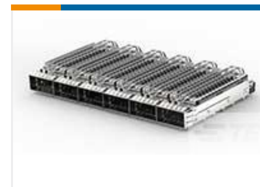
TE 产品编号2-2170708-1 CAGE ASSY, 1X6, QSFP28, SPRING, HS, LP