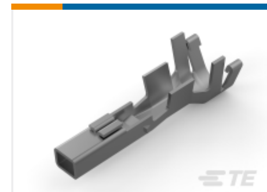
TE 产品编号177915-9 POWER DBL LOCK REC CONT