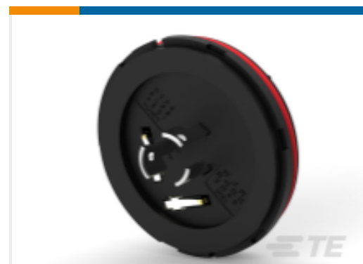
TE 产品编号1-2336396-1 ASSEMBLY, LIGHT CONTROLLER BASE, W/VENT