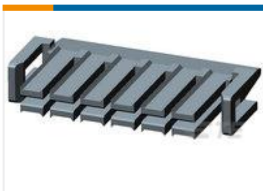
TE 产品编号2-1969541-8 RETAINER, TPA, DUAL ROW, EP2.5