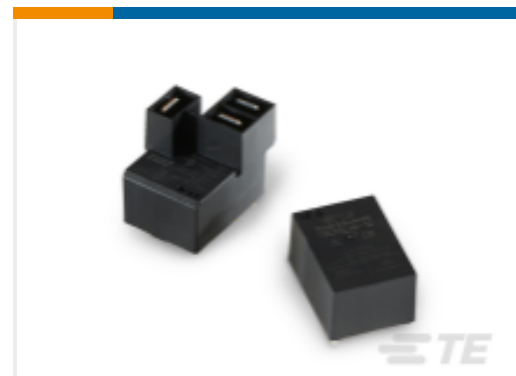
TE 产品编号1558662-4 PCB 功率继电器：30 安培，单稳直流系统