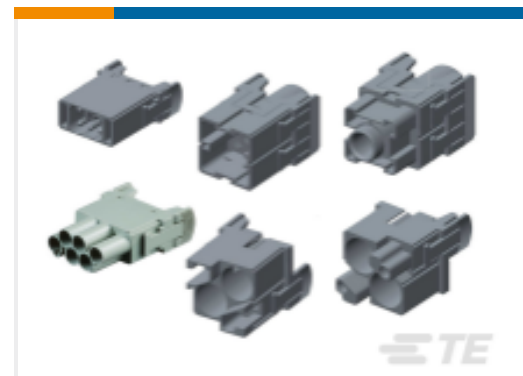
TE 产品编号T2111092201-007 HDC HMN - 符合铁路标准的模块化系统