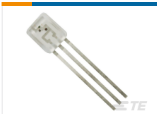
TE 产品编号11032254-00 光电发射器组件