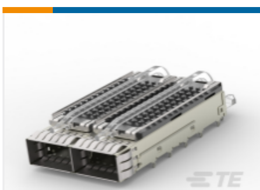
TE 产品编号2170808-1 QSFP28, 1X2, CAGE ASSY, SPRING, HS, LP