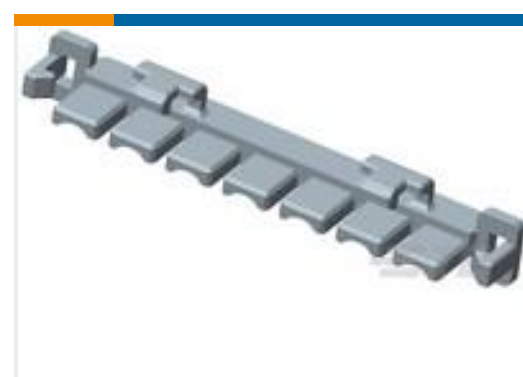
TE 产品编号1-1969609-2 12P VAL-U-LOK TPA 26-22 AWG