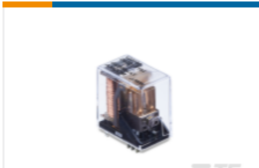
TE 产品编号4-1393810-1 信号继电器：5 安培，单稳直流