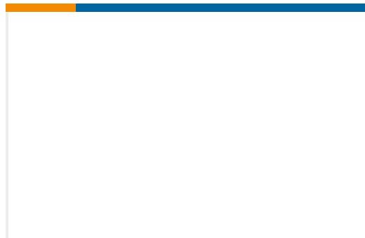
TE 产品编号709661-1 CG 10-70 A RD1070A