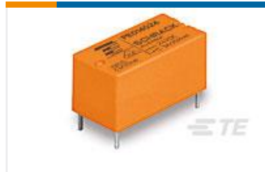
TE 产品编号4-1415535-6 PE034005