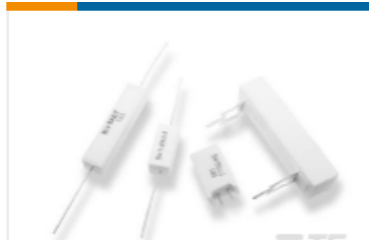
TE 产品编号1879556-1 线绕电阻器：垂直安装