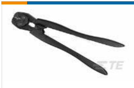
TE 产品编号46564 DAHT 24-14 ASSY