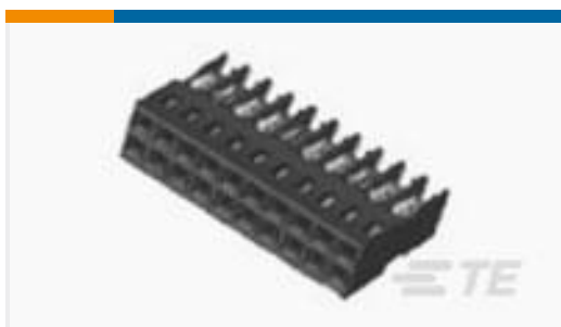
TE 产品编号102694-2 08 AMPMODU MT ASSY DR .100CL