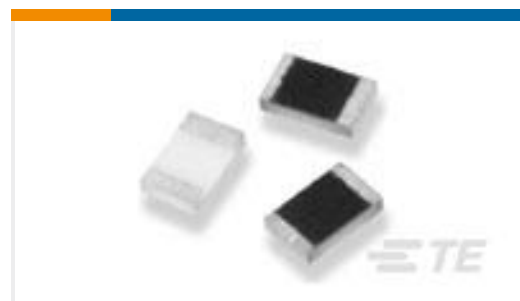
TE 产品编号2176075-3 3640 0201 0.3nH +/-0.2nH 1K RL