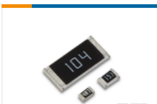
TE 产品编号3-2176342-4 CRGCQ 0805 330K 5%