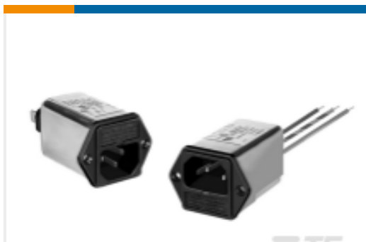
TE 产品编号1-6609115-8 CORCOM GG 系列多功能插口式滤波器