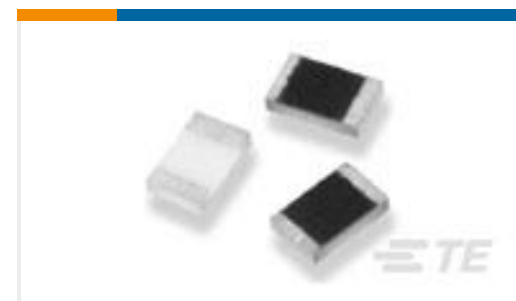
TE 产品编号2176075-5 3640 0201 0.5nH +/-0.2nH 1K RL