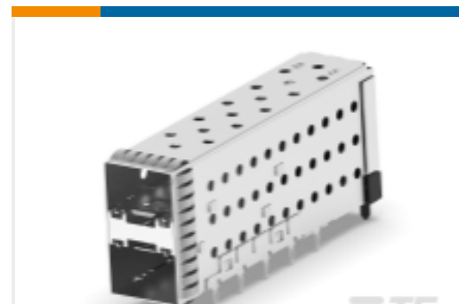
TE 产品编号1-2007637-6 SFP+ 堆叠壳体组件