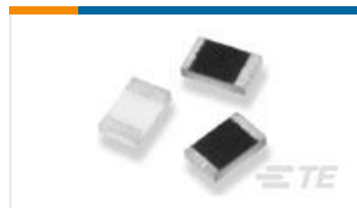
TE 产品编号2176075-4 3640 0201 0.4nH +/-0.2nH 1K RL