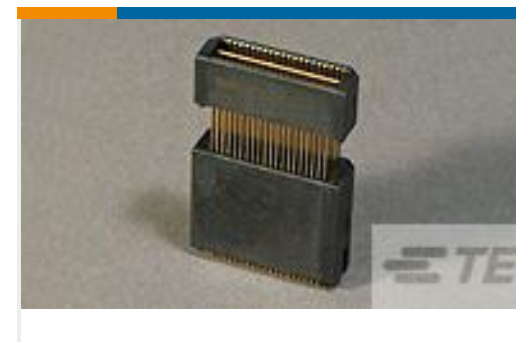
TE 产品编号1-1658051-1 MSB0.80PL30ASY28DP,-,F,VCTY