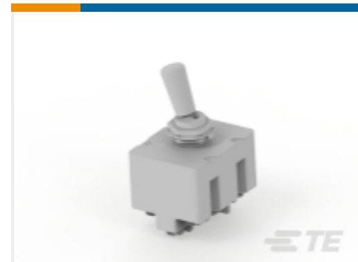
TE 产品编号K1002956 Toggle Switch 08-4-1-13