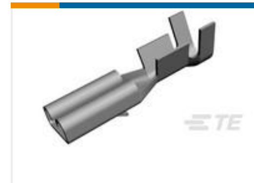
TE 产品编号160668-6 TERMINAL