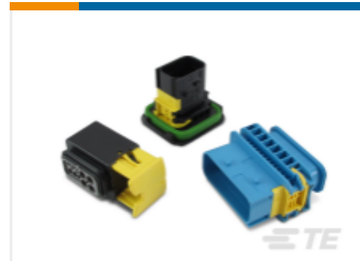
TE 产品编号2-1564532-1 重载密封连接器壳体