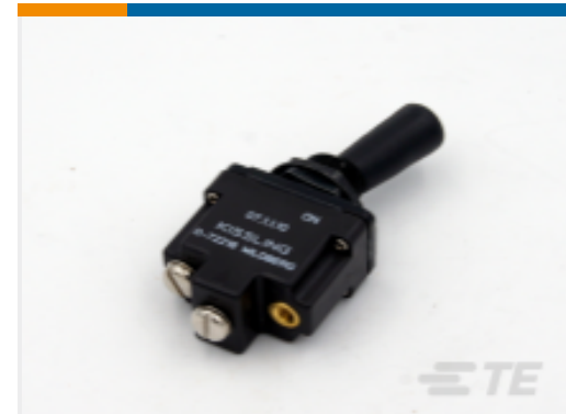
TE 产品编号K1007153 Toggle Switch 1-Pole, Sealed, Lever, Toggle, Plastic Lever