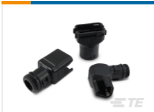
TE 产品编号1011-232-0305 DEUTSCH DT 后盖