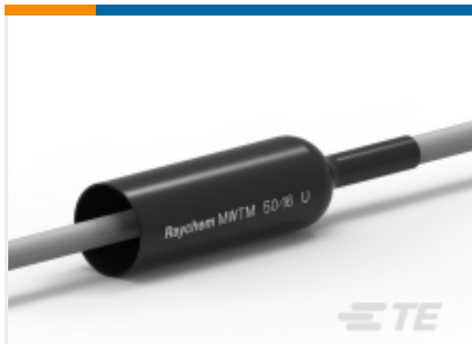
TE 产品编号834936-000 中厚壁热缩管