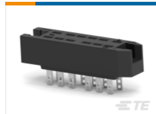
TE 产品编号1393725-4 C42334A 41A 6=RP622 FEDERLEI