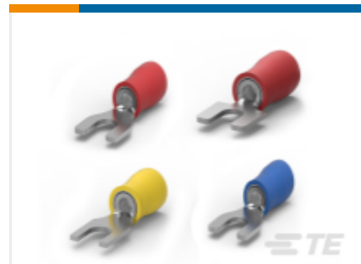
TE 产品编号32057 PIDG 叉形舌片端子