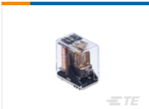
TE 产品编号1393809-1 信号继电器：5 安培，单稳直流