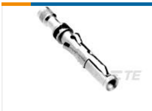
TE 产品编号202726-1 CONTACT SOCKET ASSY.