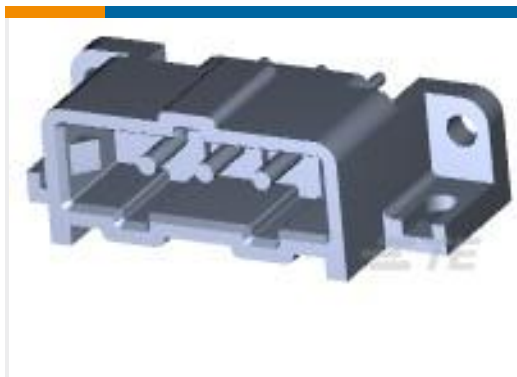
TE 产品编号207365-8 METRIMATE PIN HDR ASY,3P LF