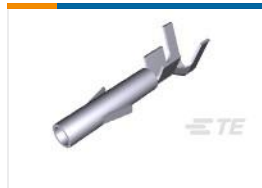
TE 产品编号350551-2 UMNL SOK 20-14 AUBR L/P