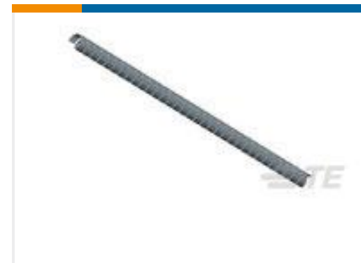
TE 产品编号142841-1 TUBING SPIRAP 500031-1