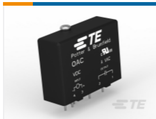
TE 产品编号 CAT-P851-OA1 固态继电器：PCB 安装