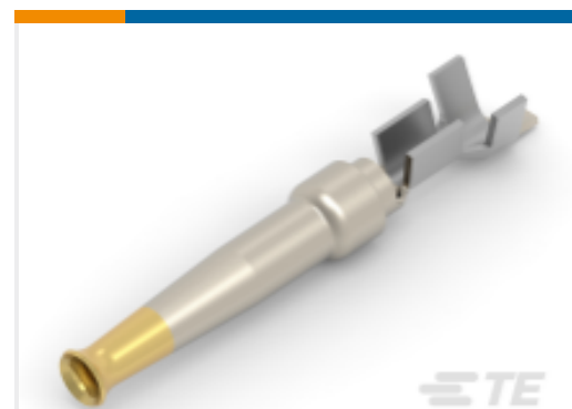
TE 产品编号1658537-2 D-Sub Conn Contacts: Socket, Phosphor Bronze, Signal, Size 20