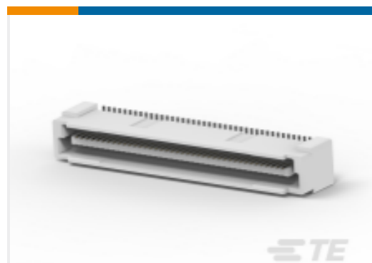
TE 产品编号1-5177986-3 Free Height Plug Connector: Board-Board, Vertical, 80, 0.8mm