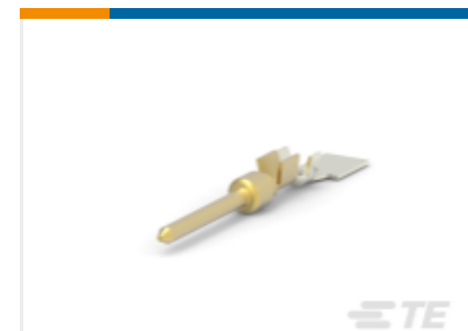
TE 产品编号1658539-3 D-Sub Connector Contacts: Pin, Brass, Signal, Size 20