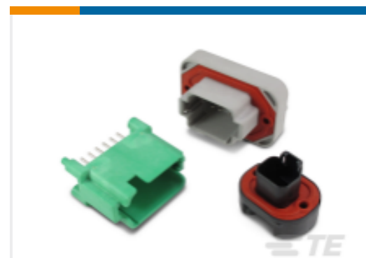
TE 产品编号DTF15-12PB DEUTSCH DT 接头