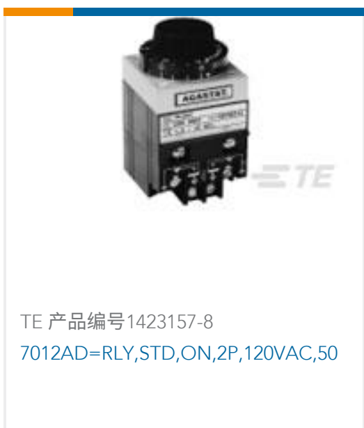
TE 产品编号1423157-8 7012AD=RLY,STD,ON,2P,120VAC,50