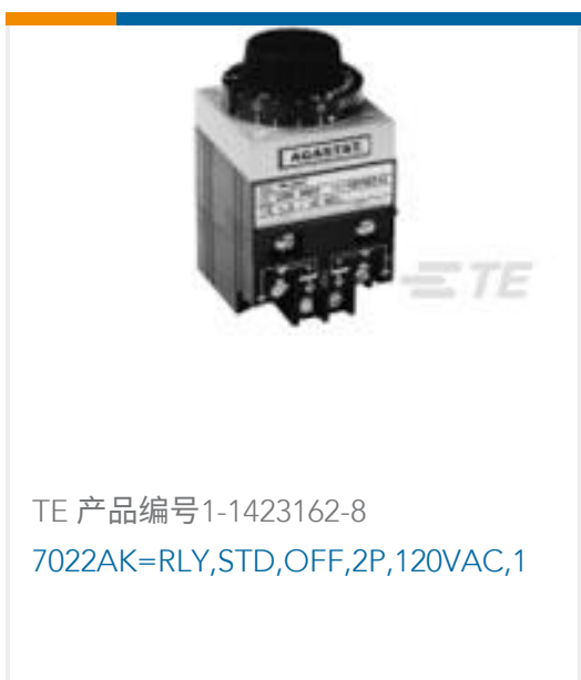
TE 产品编号1-1423162-8 7022AK=RLY,STD,OFF,2P,120VAC,1