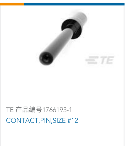
TE 产品编号1766193-1 CONTACT,PIN,SIZE #12