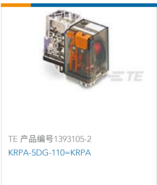
TE 产品编号1393105-2 KRPA-5DG-110=KRPA