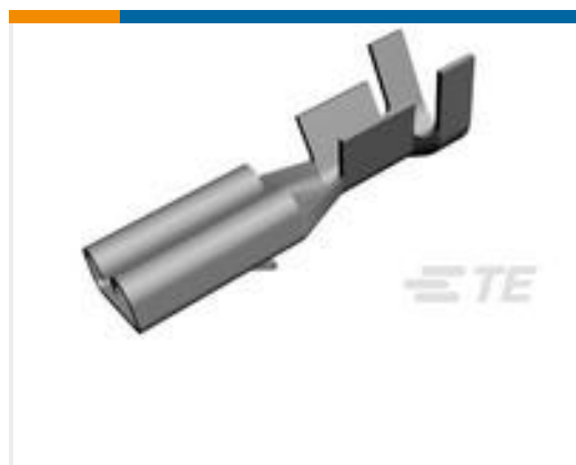
TE 产品编号160668-6 TERMINAL