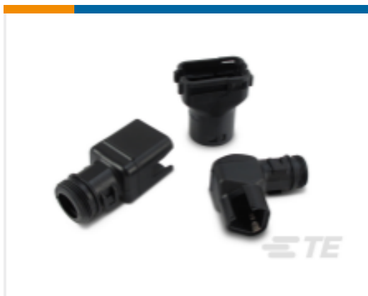
TE 产品编号1011-232-0305 DEUTSCH DT 后盖