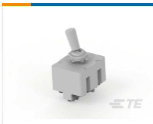
TE 产品编号K1002956 Toggle Switch 08-4-1-13