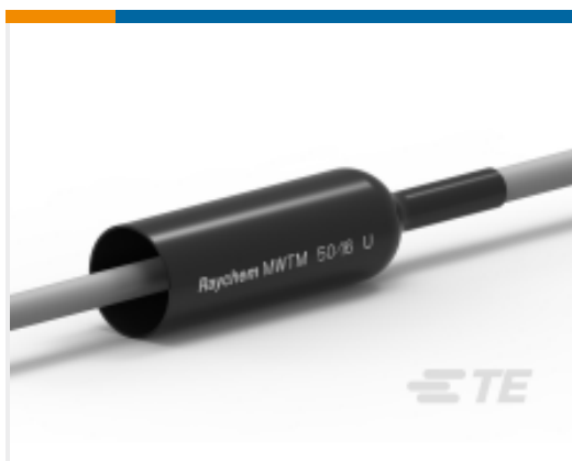
TE 产品编号834936-000 中厚壁热缩管