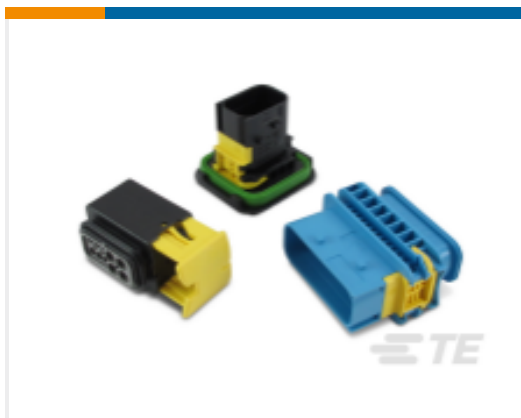
TE 产品编号2-1564532-1 重载密封连接器壳体