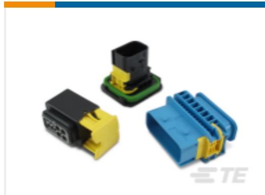
TE 产品编号2-1564532-1 重载密封连接器壳体