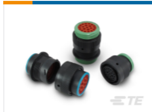
TE 产品编号YHDP26-24-35PEL017 DEUTSCH HDP20 壳体