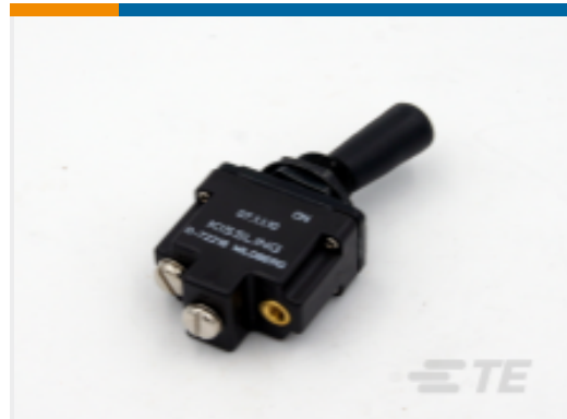
TE 产品编号K1007153 Toggle Switch 1-Pole, Sealed, Lever, Toggle, Plastic Lever