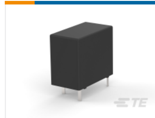
TE 产品编号1-1461116-5 STD OEG PCB OSA 功率继电器