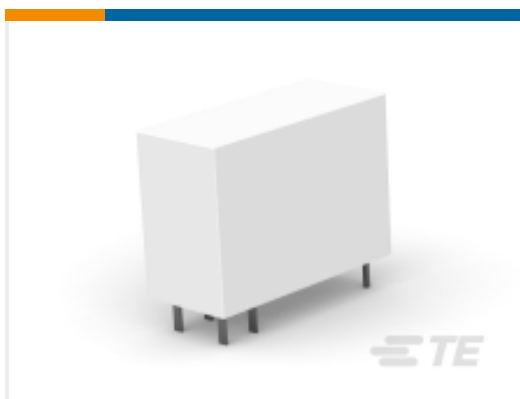
TE 产品编号1461250-2 STD SCHRACK RZF 功率继电器