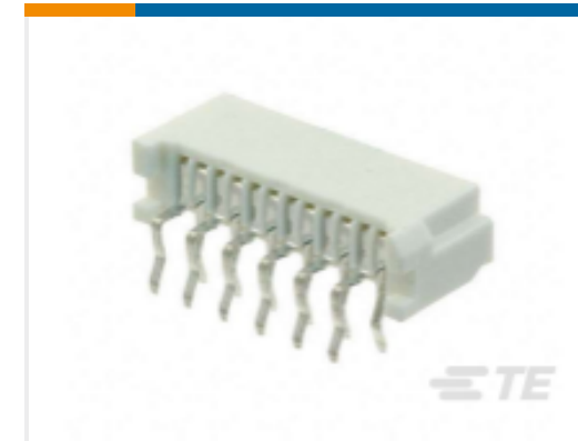
TE 产品编号1-84534-4 1.25mm FPC 连接器