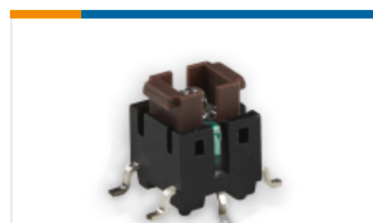
TE 产品编号1-2213819-0 6X6 ILL TACT SMT 100GF HI PURE GREEN