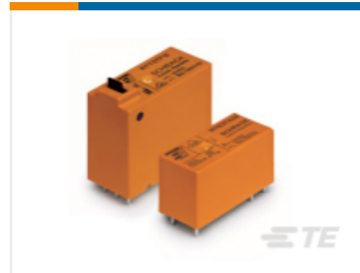
TE 产品编号1415898-1 PCB 功率继电器：16 Amp，浪涌电流