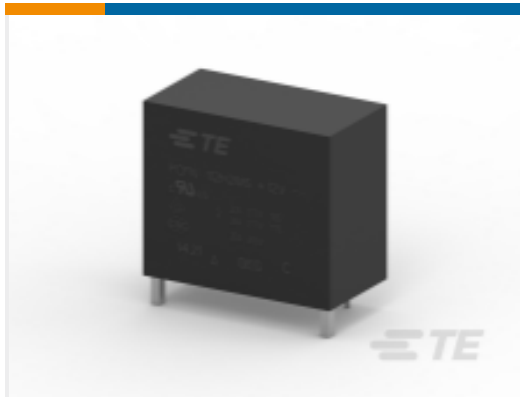
TE 产品编号9-1440003-3 PCFN 太阳能继电器