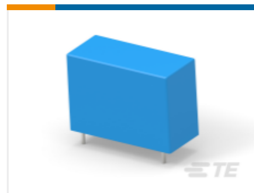
TE 产品编号1461373-9 STD OEG 小型 PCB OJT 功率继电器