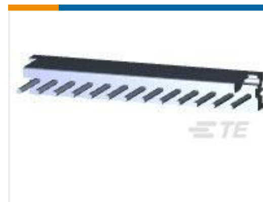
TE 产品编号1-640388-3 13P MTA156 HDR ASSY RN STR F/L