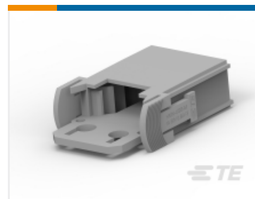
TE 产品编号T2114000101-000 HMN-USB-M