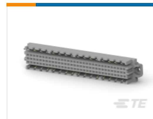
TE 产品编号5650992-5 ASSY,RECPT,ENH.TYPE C, EUROCARD,L-FREE,5