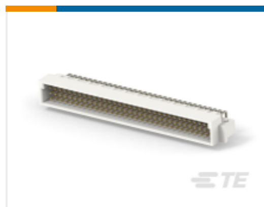
TE 产品编号6-2271013-0 CELLO,PIN,96P,TH,RA,FG,DIP4.0,-