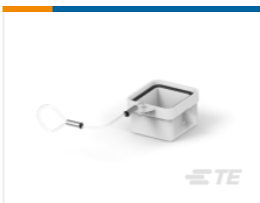
TE 产品编号T1009033100-000 H3A-KDBP