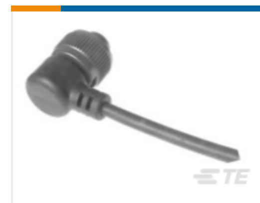
TE 产品编号318A-120 CABLE 318A