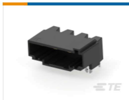
TE 产品编号3-2289080-1 Dynamic 3950 组件