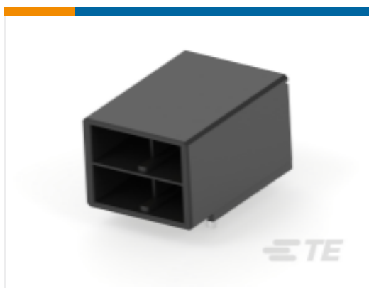
TE 产品编号3-1123829-1 Dynamic 5000 HDR 组件