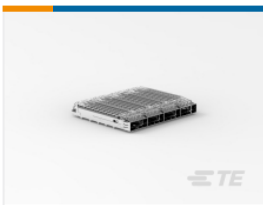
TE 产品编号4-2170747-4 CAGE ASSY, 1X4, QSFP28, SPRING, HS, LP