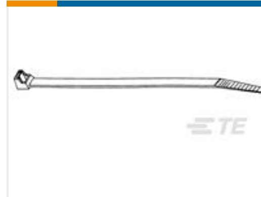
TE 产品编号1-608692-0 CABLE TIE,RELEASABLE,BLK,100PK