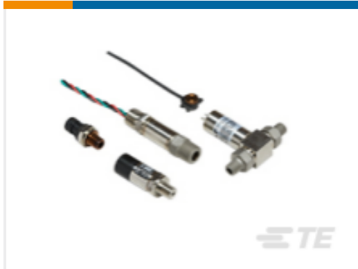
TE 产品编号10201889-00 压力传感器 (现货)