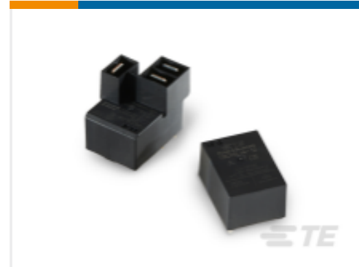
TE 产品编号1558676-1 PCB 功率继电器：30 安培，单稳直流