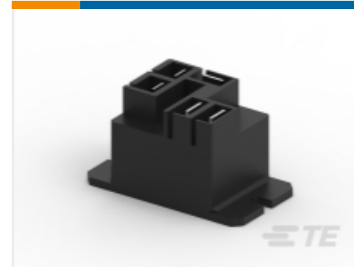
TE 产品编号1-1649341-9 T9CP5A54-120