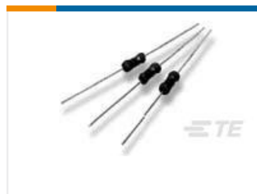
TE 产品编号1-1625893-4 5W SM M/OX 2% 27R