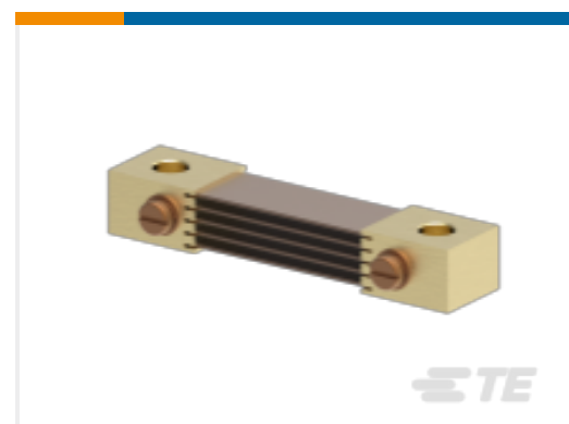
TE 产品编号CK0345-000 CI-FH5050