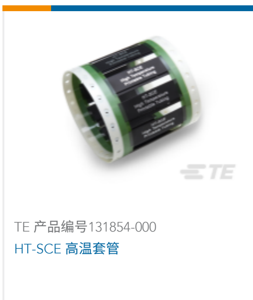
TE 产品编号131854-000 HT-SCE 高温套管