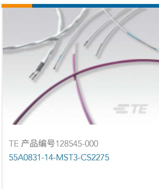
TE 产品编号128545-000 55A0831-14-MST3-CS2275