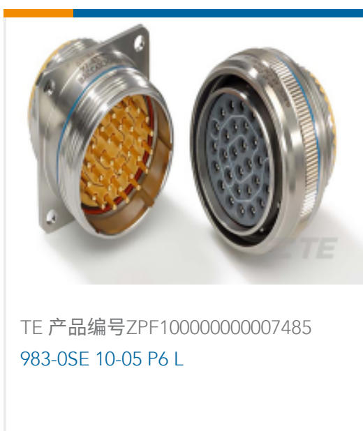
TE 产品编号ZPF10000000007485 983-05E 10-05 P6 L