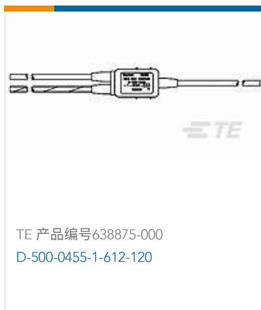
TE 产品编号638875-000 D-500-0455-1-612-120