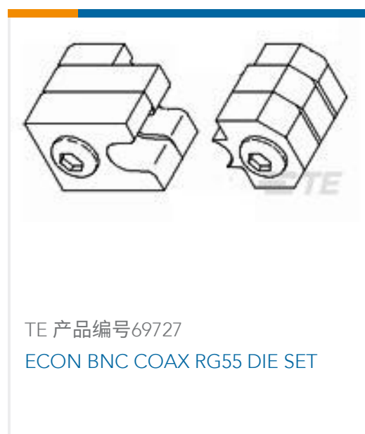
TE 产品编号69727 ECON BNC COAX RG55 DIE SET