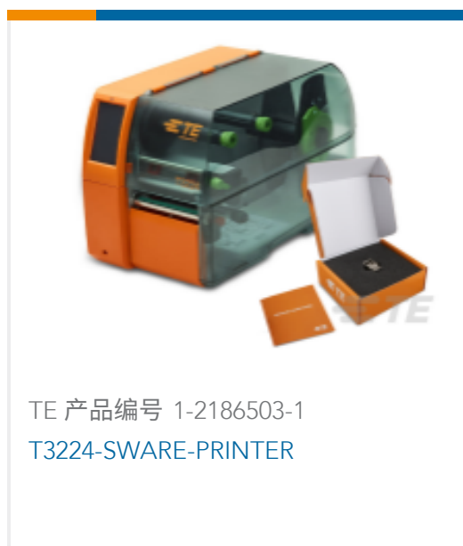
TE 产品编号 1-2186503-1 T3224-SWARE-PRINTER