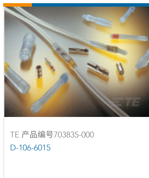
TE 产品编号703835-000 D-106-6015