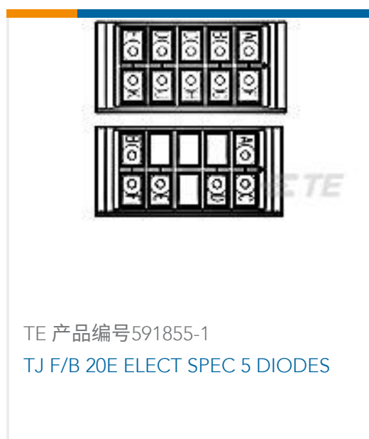
TE 产品编号591855-1 TJ F/B 20E ELECT SPEC 5 DIODES