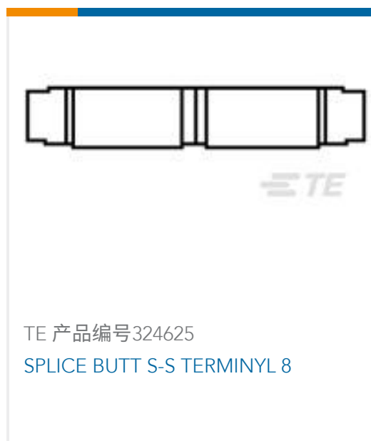
TE 产品编号324625 SPLICE BUTT S-S TERMINYL 8