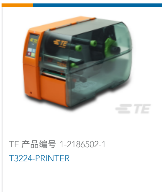
TE 产品编号 1-2186502-1 T3224-PRINTER