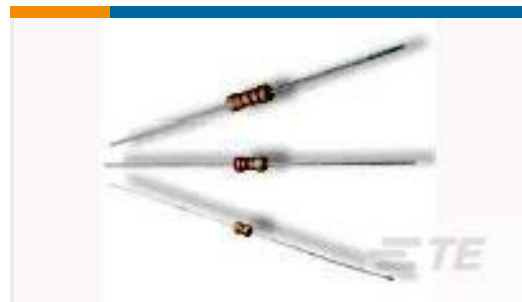
TE 产品编号1-1623931-9 CFR25 5% 39R