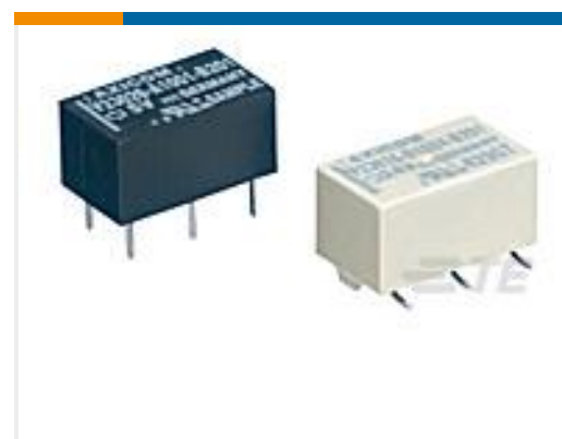
TE 产品编号1-1393774-7 V23026A1006B201