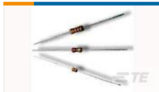
TE 产品编号2-1623931-9 CFR25 5% 3R9