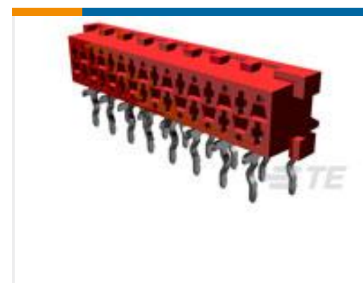
TE 产品编号8-215460-6 MICRO-MATCH FSID P