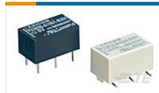
TE 产品编号2-1393774-0 V23026C1051B201