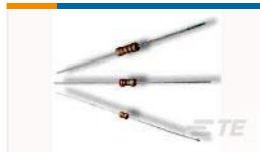
TE 产品编号8-1623931-4 CFR25 5% 8R2