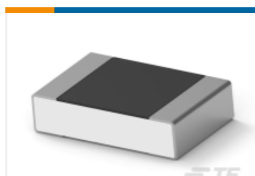
TE 产品编号4-2176373-1 RQ 0805 26R1 0.1% 10PPM 1K RL