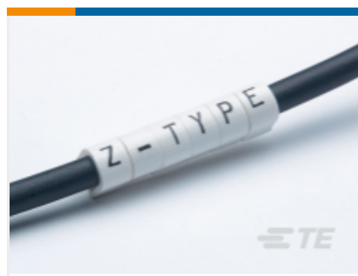
TE 产品编号EJ1954-000 Z-TYPE 推入式标志