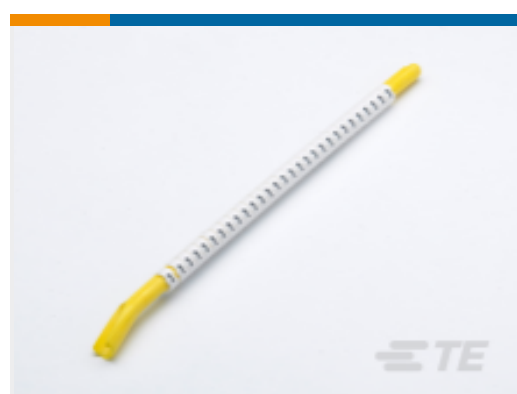
TE 产品编号 CAT-T3437-ST2999 STD 搭锁式标志