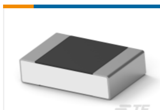
TE 产品编号2-2176373-6 RQ 0805 18R2 0.1% 10PPM 1K RL