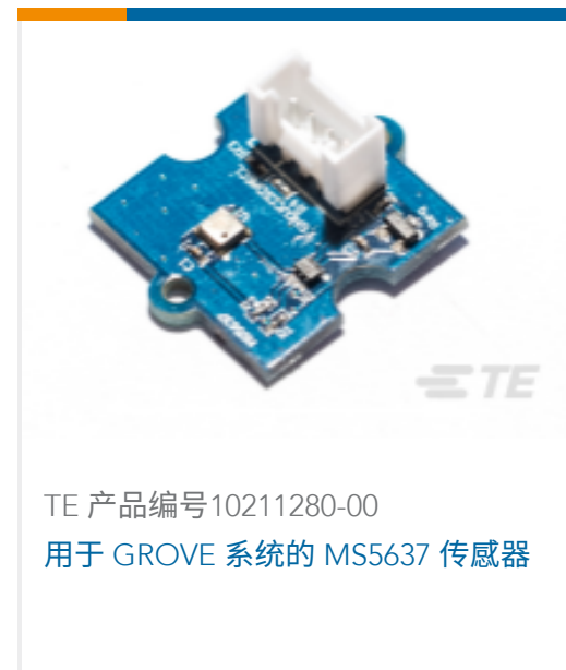
TE 产品编号10211280-00 用于 GROVE 系统的 MS5637 传感器