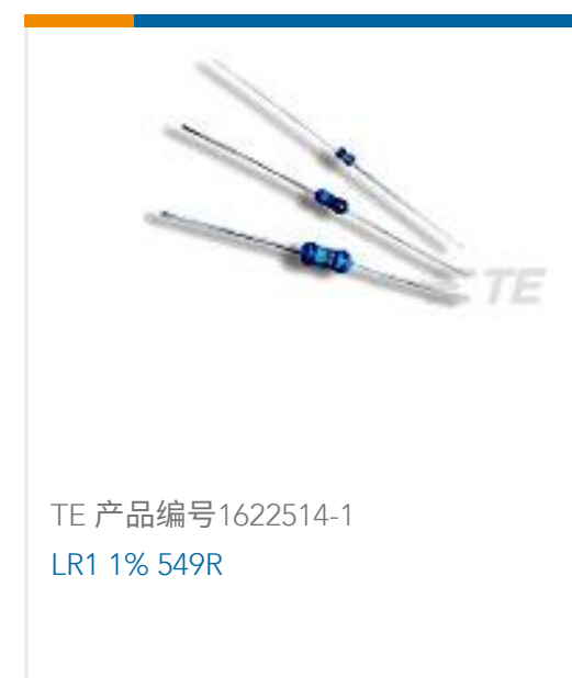
TE 产品编号1622514-1 LR1 1% 549R