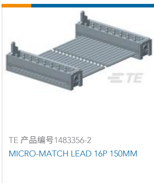
TE 产品编号1483356-2 MICRO-MATCH LEAD 16P 150MM