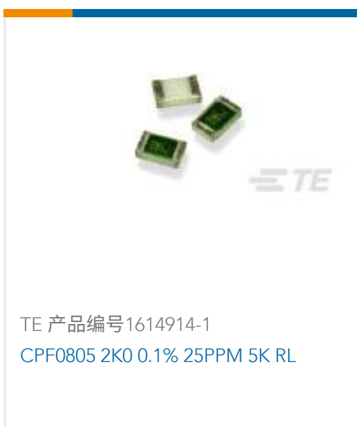
TE 产品编号1614914-1 CPF0805 2K0 0.1% 25PPM 5K RL