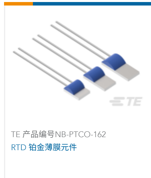
TE 产品编号NB-PTCO-162 RTD 铂金薄膜元件