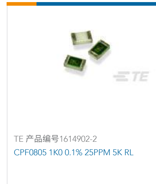
TE 产品编号1614902-2 CPF0805 1K0 0.1% 25PPM 5K RL