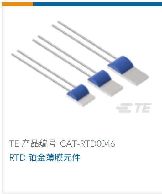
TE 产品编号 CAT-RTD0046 RTD 铂金薄膜元件