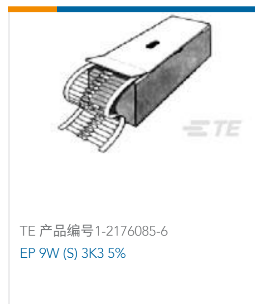
TE 产品编号1-2176085-6 EP 9W (S) 3K3 5%