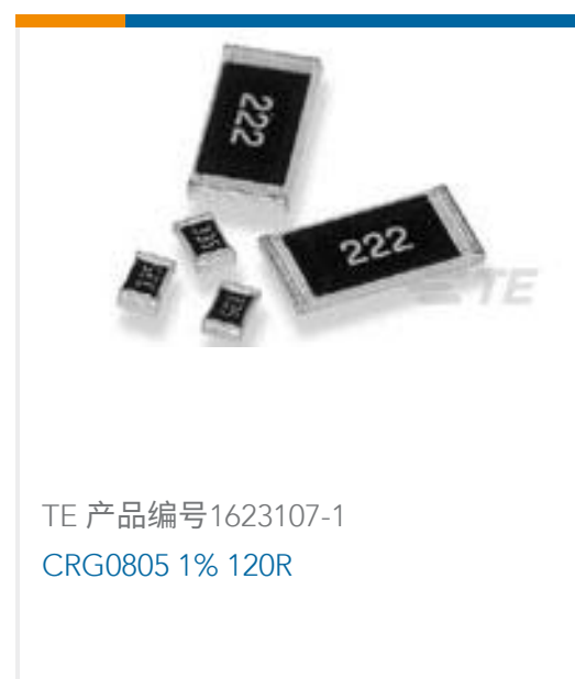
TE 产品编号1623107-1 CRG0805 1% 120R