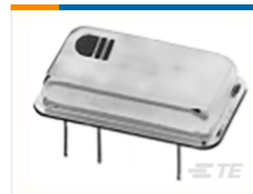
TE 产品编号3-1618400-8 DS11-1005T=SOLID STATE RELAY