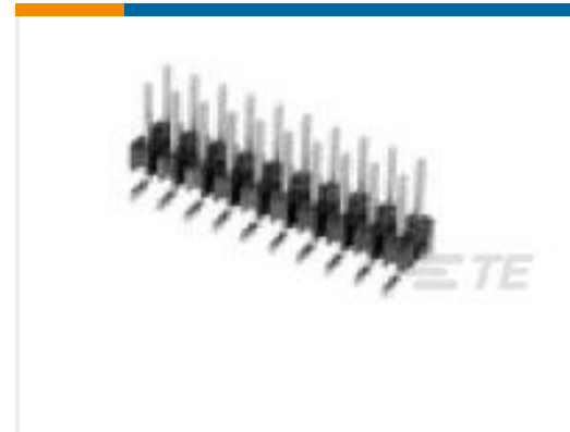
TE 产品编号147279-4 04 MODII HDR DR SFMT B/A T&R