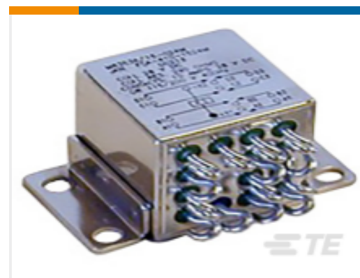
TE 产品编号3-1617805-1 TD229-3002S=TDNR 30 SEC