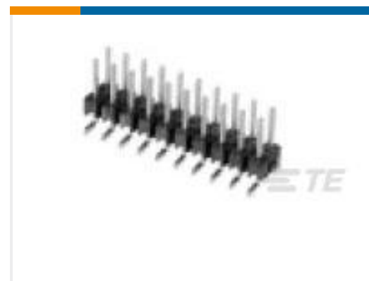
TE 产品编号147279-5 20 MODII HDR DR SFMT B/A T&R