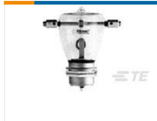
TE 产品编号6-1618273-2 H-24=RELAY, VACUUM, SPST-NO