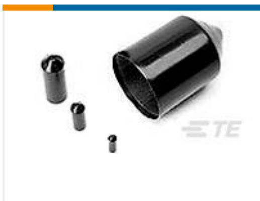
TE 产品编号843408-000 101A041-4-0