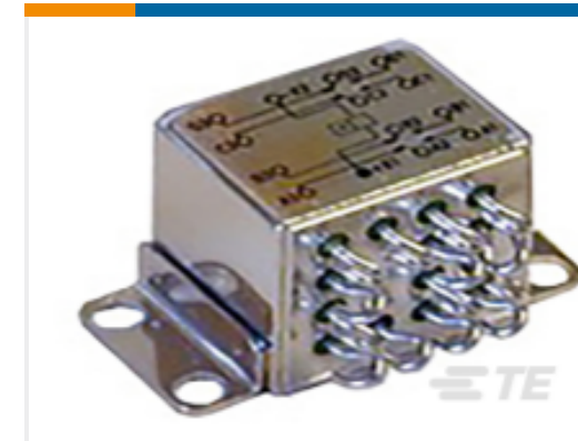
TE 产品编号1-1617787-0 FCB-405-0520L=M83536/5-020L